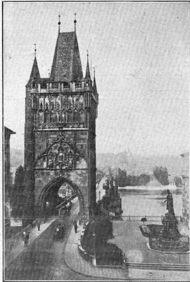
TURO DE LA PONTO DE KAROLO IV. EN PRAHA

ĝian kredon el la radiko mem. Bohemujo, senkapigita senglave, suferinta dum du jarcentoj la plej teruran despotismon religian kaj politikan, ĉesis ludi sian rolon inter la nacioj sendependaj. La katolika reakcio estis nenie tiom kruela kaj malbonsorta kiel tie, ĉar regantoj nekapablaj direktis ĝian laboron.