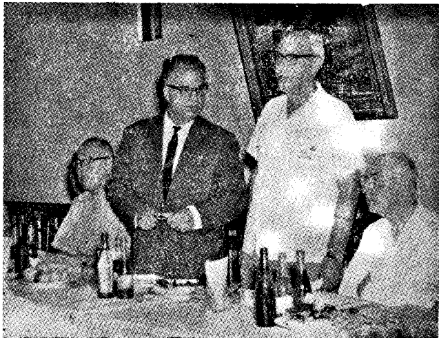
La prezidantaro de la gazetara konferenco, okazinta la 2-an de aŭgusto 1968 en la Domo de la bulgaraj ĵurnalistoj

Posttagmeze grupo de TEJA-anoj k. a., vizitis la redakciojn de la plej grandaj ĉiutagaj ĵurnaloj en la lando — „Rabotriĉesko Delo“ kaj „Oteĉestven Front“ — kaj ankaŭ