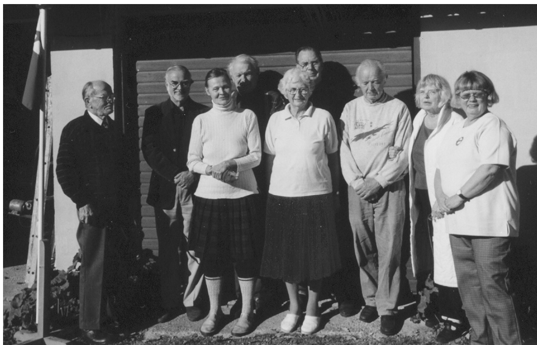
La kursanoj de Ruds Vedby. Vidu dorsflanke de ĉi tiu numero.