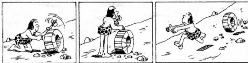
Radinvento ....kaj sekvoj.

Vagonarformo: 1 vagono kun stiristejo + 4 vagonoj + E.464; longo 164,460 m; larĝo 2,774 m; alto totala 4,300 m; alto super relsupronivelo 0,600 m; alto etaĝoj (malsupre = supre) 1,920 m; rapido maksimuma 160 Km/h; larĝo enirporda 1,800 m; kapacito totala po trajnunuo 562 sidlokoj; bruo < 65dB.