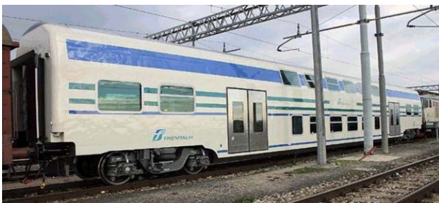
Carrozza - Pasagervagono

liano “Corifer”, ed è composto da 5 carrozze a due piani, (una semipilota, tre carrozze di seconda classe e una di prima classe) e da una moderna locomotiva E464.