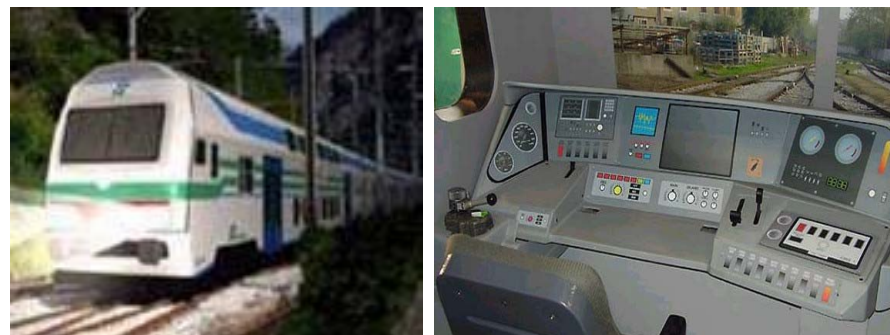
Carrozza semipilota e relativa cabina di guida - Pasaĝervagono kun stirejo ekstere kaj interne

Ĉi tiu trajno havos transport-eblecon ĝis 842 personoj (558 sidlokoj) kaj atingas la maksimuman rapidon je 160 km/h. Por pli faciligi la eniron kaj eliron estis realigitaj pordoj pli larĝaj ol ĉe aliaj vagonoj: 180 cm, kaj en la stacidomoj kun pli altaj ka-