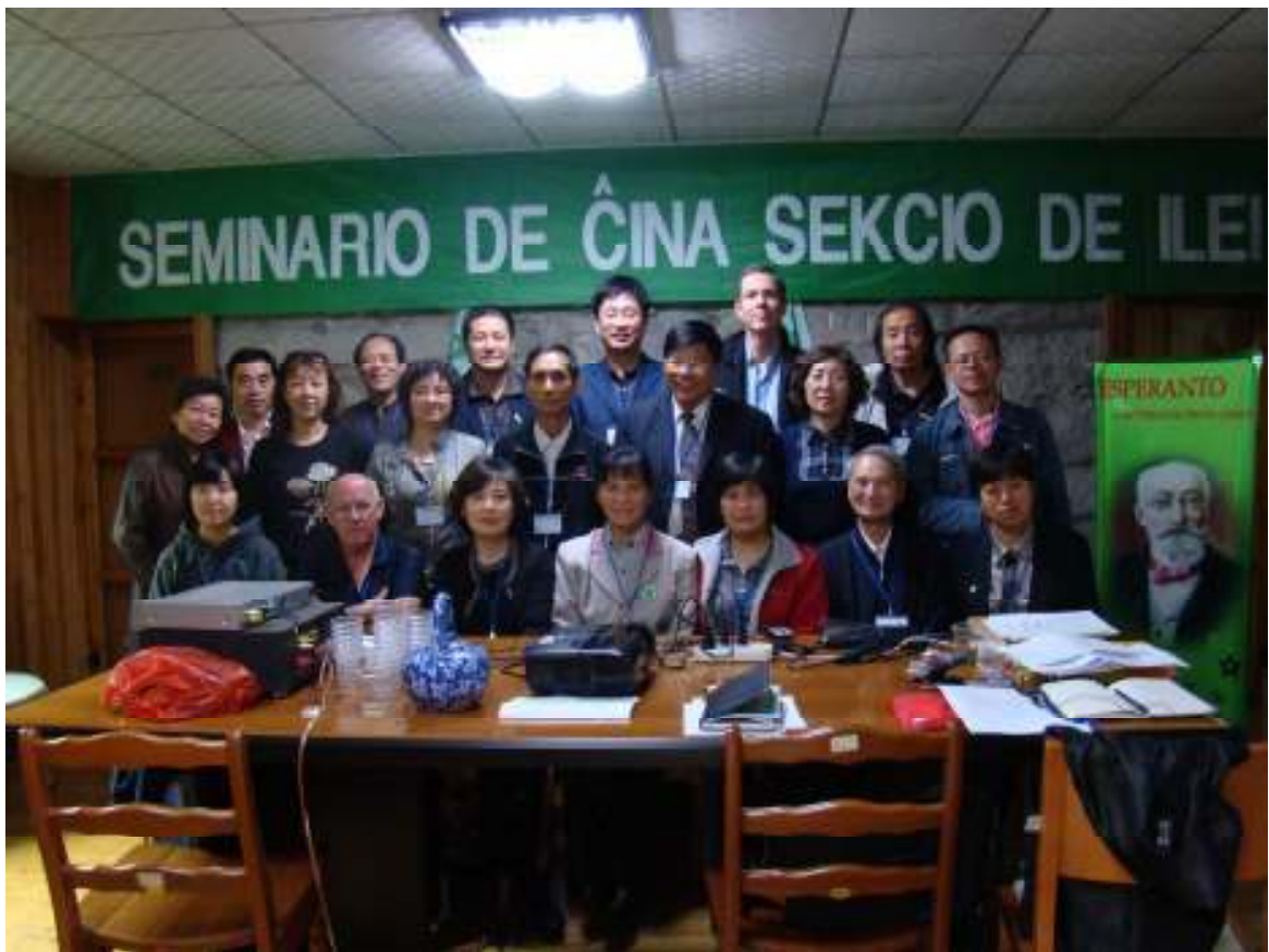
Seminario de ILEI-Ĉinio okazis en la Lushan-Montaro (vd p.16)