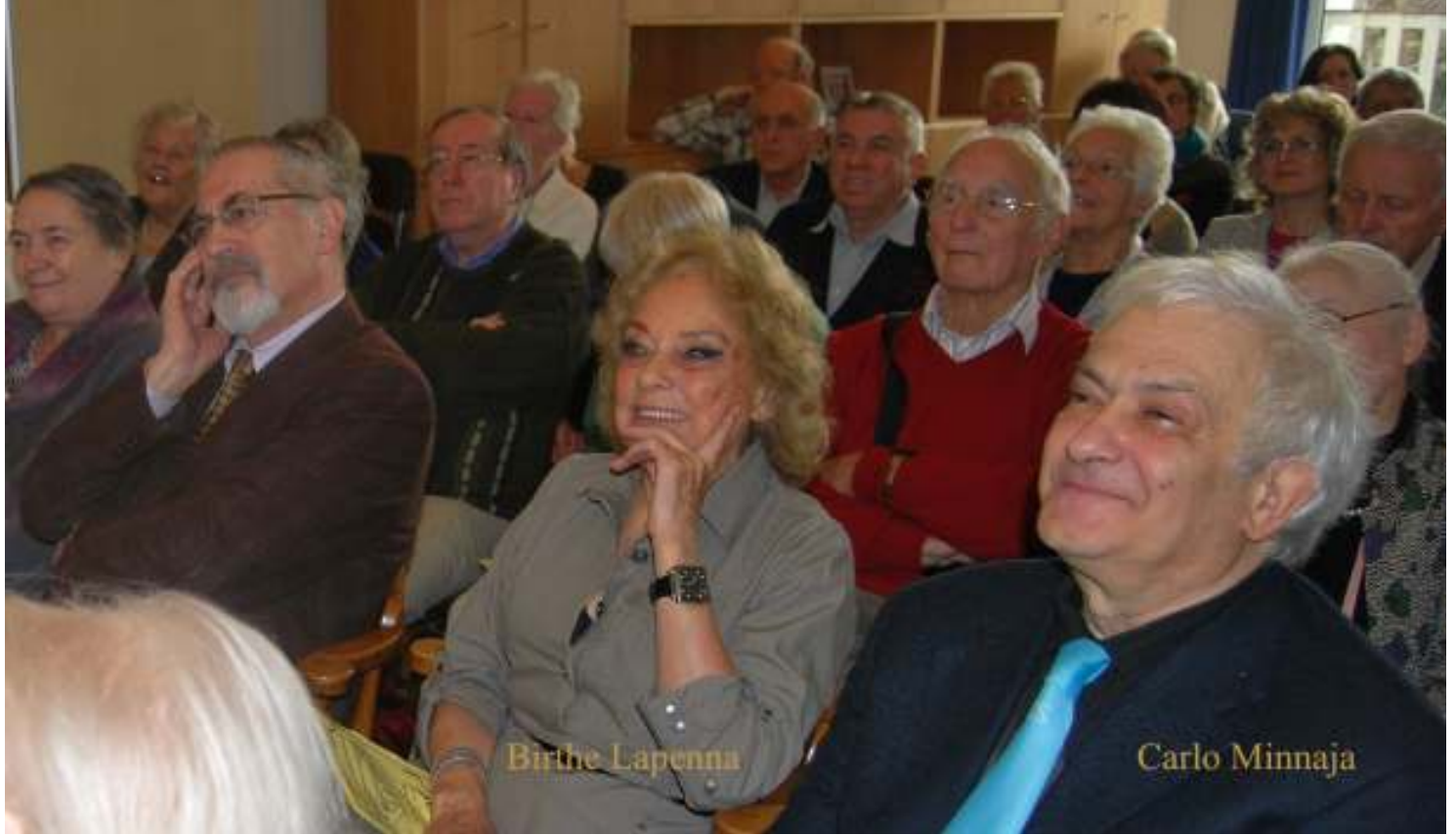
La publiko de la Malferma Tago de UEA.