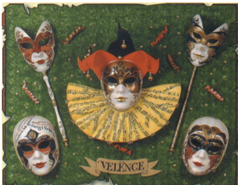
Karnavalaj maskoj de Venezio el sukero – el Kopcsik Marcipanio en urbo Eger