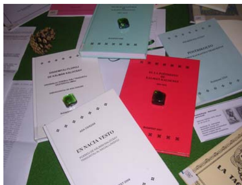
Fotoj pri la ekspoziciitaj libroj