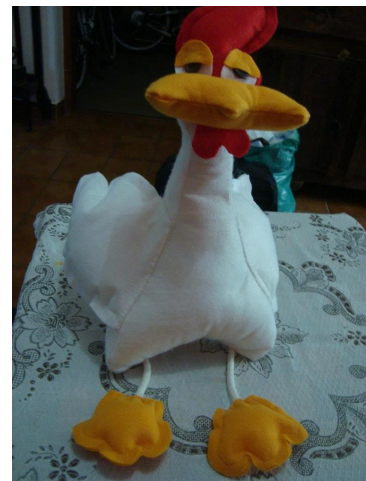
Aliĝu, aŭ Poso ploros!

Riĉa Eŭropo: AD, AT, UK, DK, FI, FR, DE, ES, IR, IS, IT, LI, LU, MT, MC, NO, PT, SE, CH, kaj nerekonitaj ŝtatoj en la teritorio de tiuj ŝtatoj.