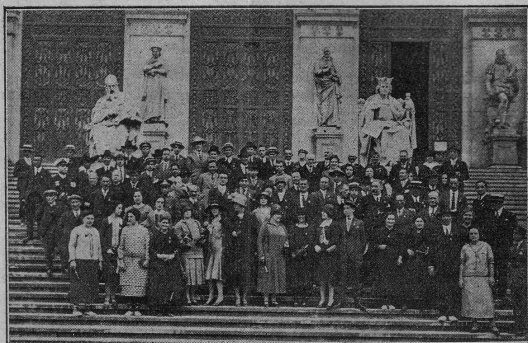
Grupo de congresistas saliendo del Museo de Arte Moderno de Madrid.

pués tan sólo en unos cuantos paseos por las tardes hizo posible las visitas a museos, parques, palacios, ministerios y grandísimo número de otras notabilidades dignas de verse. Pero todo, naturalmente, gracias a la fuerza de nuestras