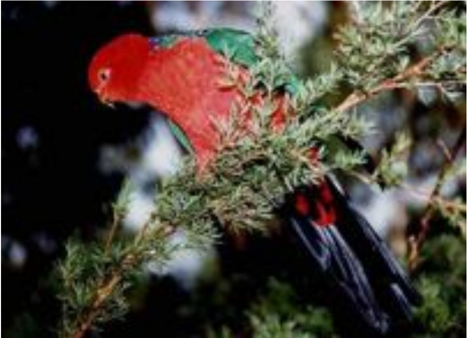
Reĝa Papago (Aŭstralia) [ALISTERUS SCAPULARIS]