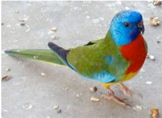
Aŭstralia skarlatbrusta parakito [NEOPHEMA SPLENDIDA}