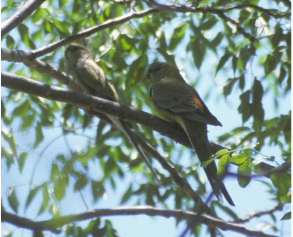
Ruĝglutea papago [PSEPHOTUS HAEMATONOTUS]