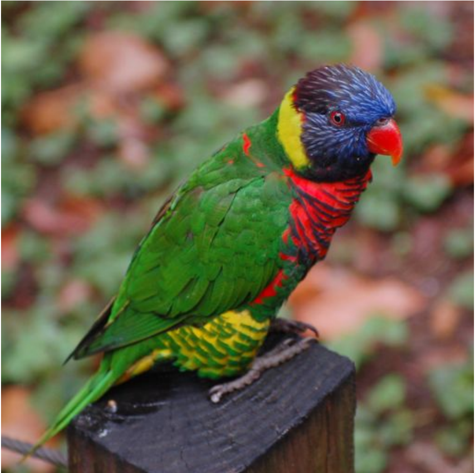
Ĉielarka Lorikito [Trichoglossus haematodus]