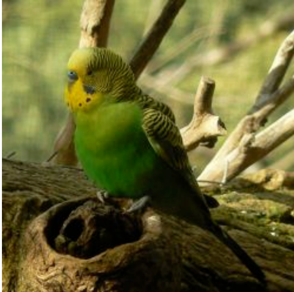
Melopsitako [MELOPSITTACUS UNDULATUS]