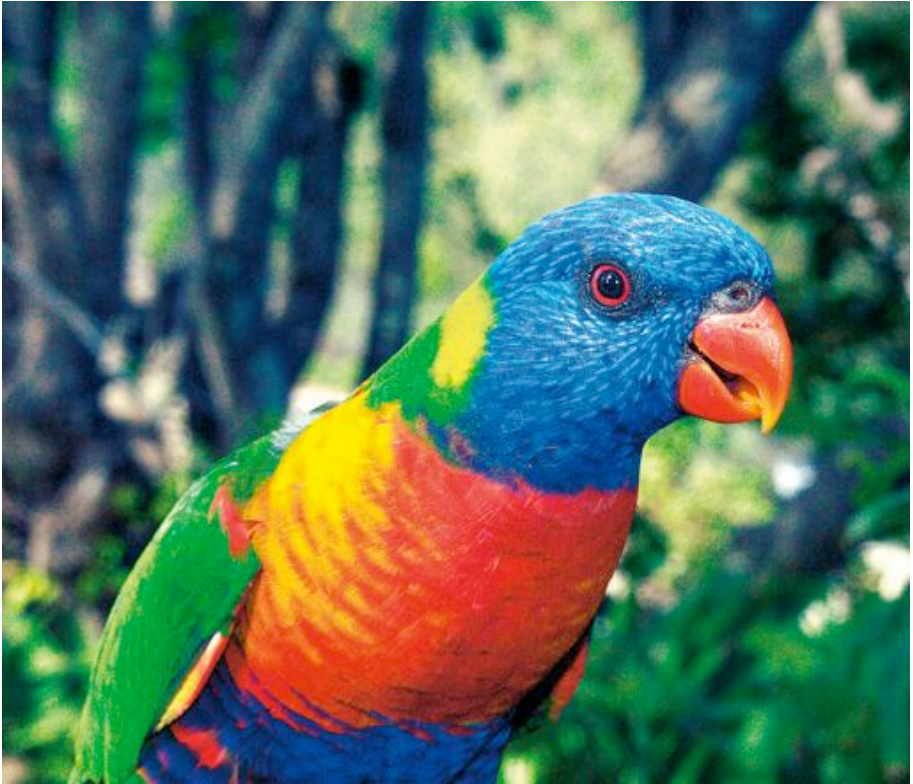
Ĉielarka Lorikito (Aŭstralia) [TRICHOGLOSSUS HAEMATODUS]