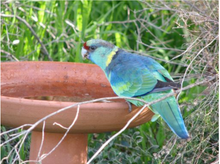
Aŭstralia ringokola parakito [PSITTACULA KRAMERI]