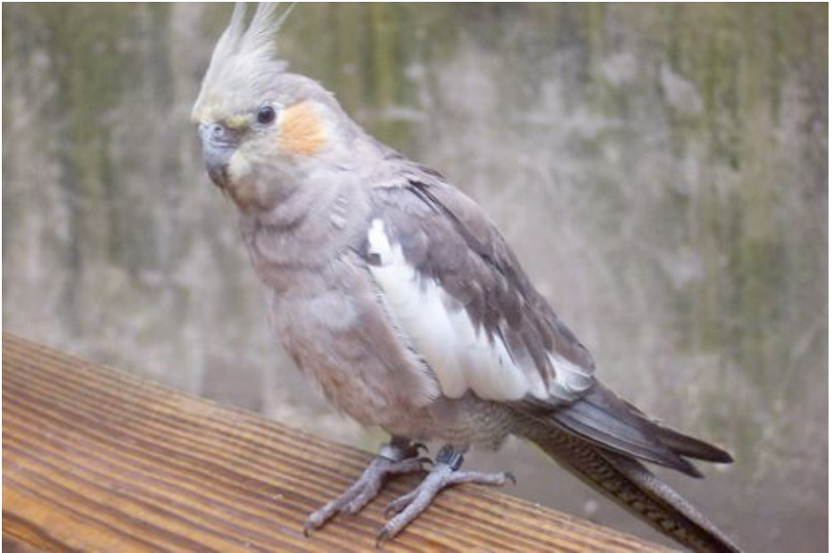
Lorikito (Aŭstralia) [subfamilio LORLINAĖ]