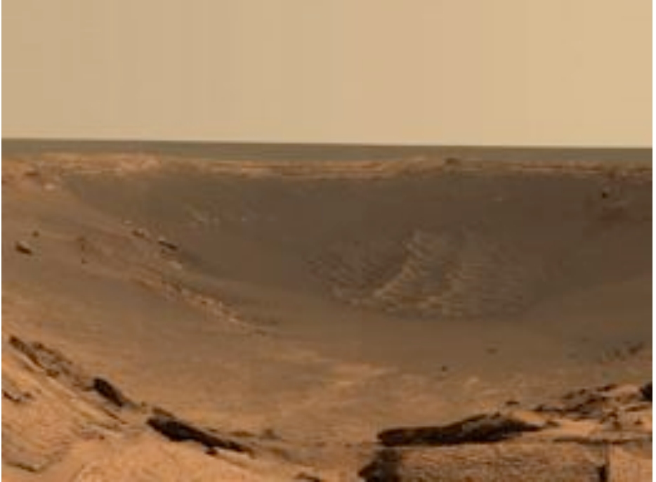
Kratero sur Marso