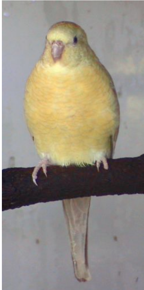
Opala PSEPHOTUS HAEMATONOTUS