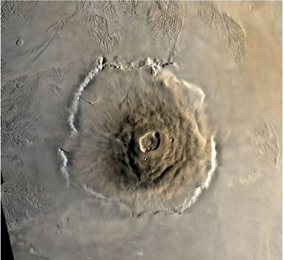
Vulkano sur Marso