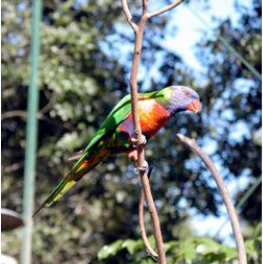
Lorikito (Aŭstralia) [subfamilio LORLINAĖ]