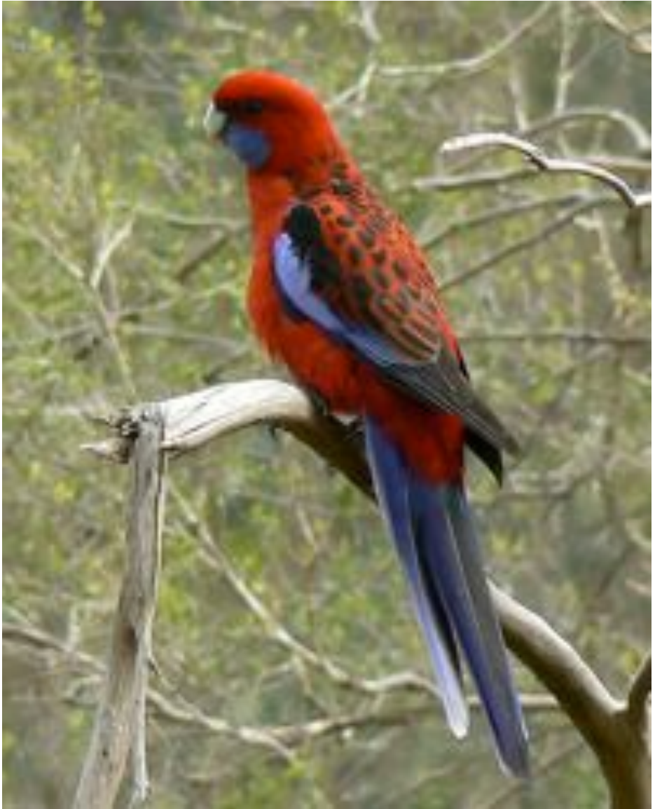
Karmina Rozelo (Aŭstralia) [PLATYCERCUS ELEGANS]