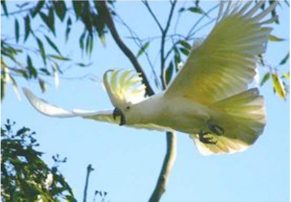
Sulfurtufa kakatuo [CACATUA GALERITA]