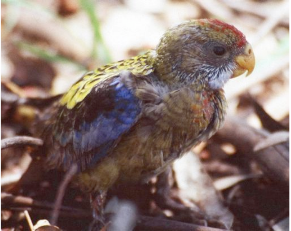
Hibrida Rozelo (Aŭstralia) [genro PLATYCERCUS]