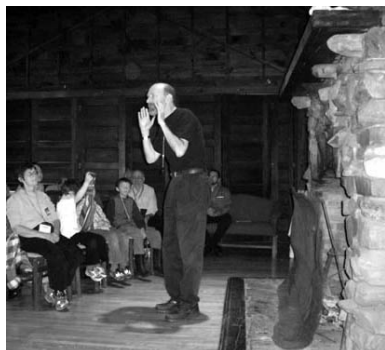
kultura vespero dum ARE 2005