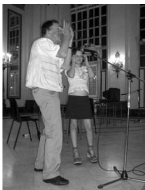
gekanadananoj, de oriento kaj okcidento, kune prezentis en Kubo