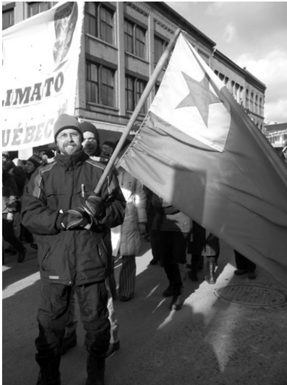
Esperantistoj manifestacias surstrate en Montrealo! (pĝ 4)