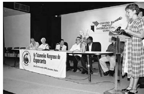
solena malfermo de TAKE 6

Dum la malfermo ankoraŭ okazis, tri personoj deĵoris ĉe tablo en la enirejo, donante nomŝildojn, dokumentojn, informojn. Post ricevo de miaj dokumentoj, mi iris malsupren al la 'Salono Zamenhof' kaj ĝuis la finan prezenton de lerneja koruso en perfekte prononcita Esperanto.