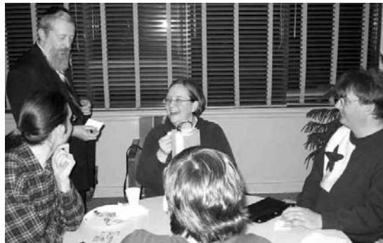
Torontanoj festas Zamenhof-tage