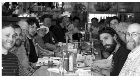
MEKAR-anoj vespermanĝas ĉine