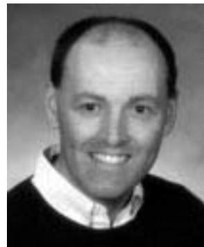
Graham Steele, nov-skotia parlamentano kaj esperantisto

Dank' al la klopodoj de Graham Steele , esperantisto kaj ano de la Nov-Skotia parlamento, rezolucio gratule rekonanta la laboron de la nov-skotia esperantistaro estis prezentita al nov-skotia parlamento la kvinan de majo (2005) kaj akceptita. Ĉi tiu rezolucio eble ne estas la unua rezolucio favora al Esperanto prezentita al kanada parlamento (aŭ eble jes?), sed la aperigo de ĝia teksto en Esperanto en la oficialaj parlamentaj tekstoj, trovebla en la tuttera teksaĵo (“la Reto”) ĉe http://www.gov.ns.ca/legislature/hansard/han59-1/house_05may05.htm (paĝo 7068), certe estas novaĵo. Ĉi-sube ni prezentas la rezolucion en plena formo, tio estas, en Esperanta kaj angla versioj kaj invitas vin viziti la retejon de Graham Steele - kun Esperanta informo-fenestro! - http://www.grahamsteele.ca/gs_main_esperanto.html kaj danki lin pro lia tre publika kaj aktiva subteno al Esperanto.