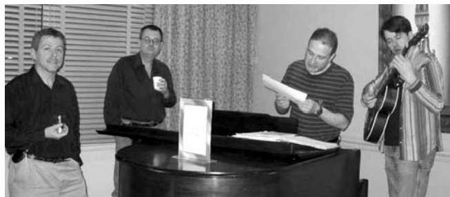
muzikumado dum MEKARO

Inter la 5a kaj 7a ptm ni (krom Lunjo, kiu restis en la festĉambro por bonvenigi eventualajn alvenantojn) kune manĝis en la apuda Vjetnama restoracio 'Peach Garden'.