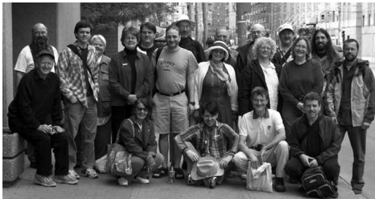
partoprenantoj de MEKARO 2005

La renkontiĝejo estis en loko kiun la Torontaj esperantistoj uzas por festoj kaj troviĝas ĉe 77 Carlton Strato, nur kvin-minuta promeno piede orienten de metroa stacidomo College.