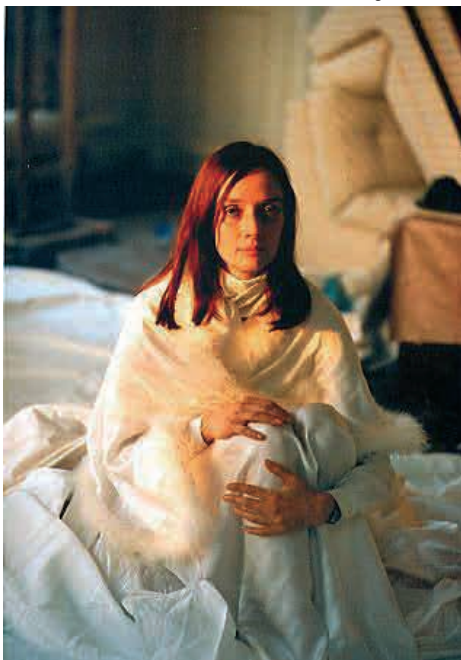
Niki de Saint Phalle

Niki de Saint Phalle naskiĝis en Francio la 29-an de oktobro 1930 kaj el-