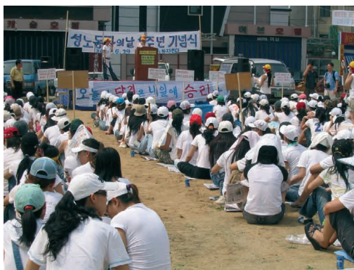
Fotis: "asocio de demokrataj sekslaboristoj"

de patriarka monogamio. Nuntempa patriarka monogamio estas praktike poligamio. Tio estas, ĝi havas gravan kontraŭdiron. Por ke poligamio subtenu monogamian karakteron, eksteredzineco-rilato devas esti nenormala kaj malleĝa kaj mortema. Tiu ĉi sinteno estas kompreneble konservema. Ke en korea 'Fako de fraŭlino-familio', kiun