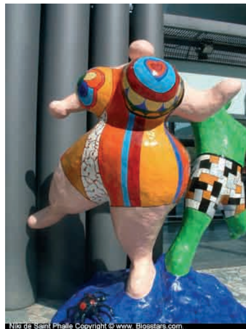
Niki de Saint Phalle

Aktivulino de la asocio AIDS kaj grava observantino de sia epoko, Niki de Saint Phalle mortis en San Diego la 21-an de majo 2002 pro la venenaj vaporoj de la materialoj kiujn ŝi uzis por krei siajn skulptaĵojn.