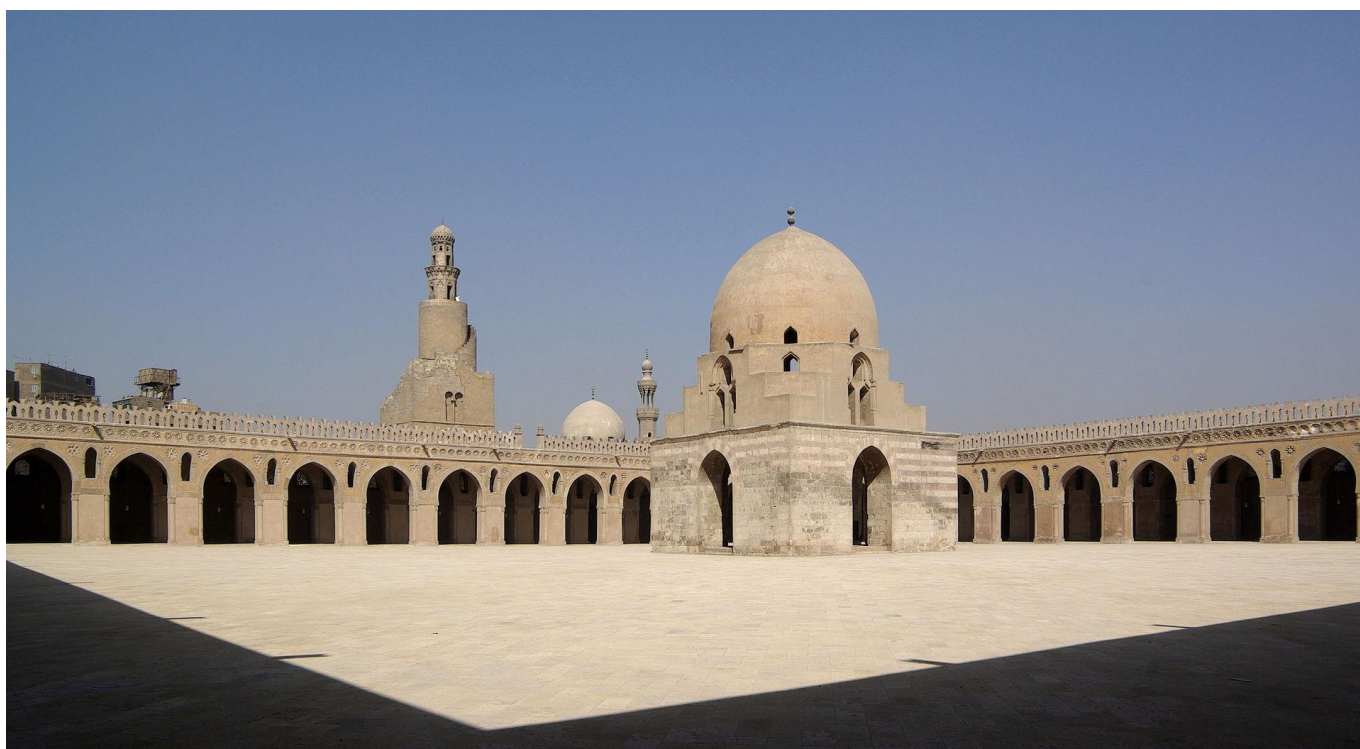
Bildo 1 Ibn Tulun-Moskeo en Kairo.