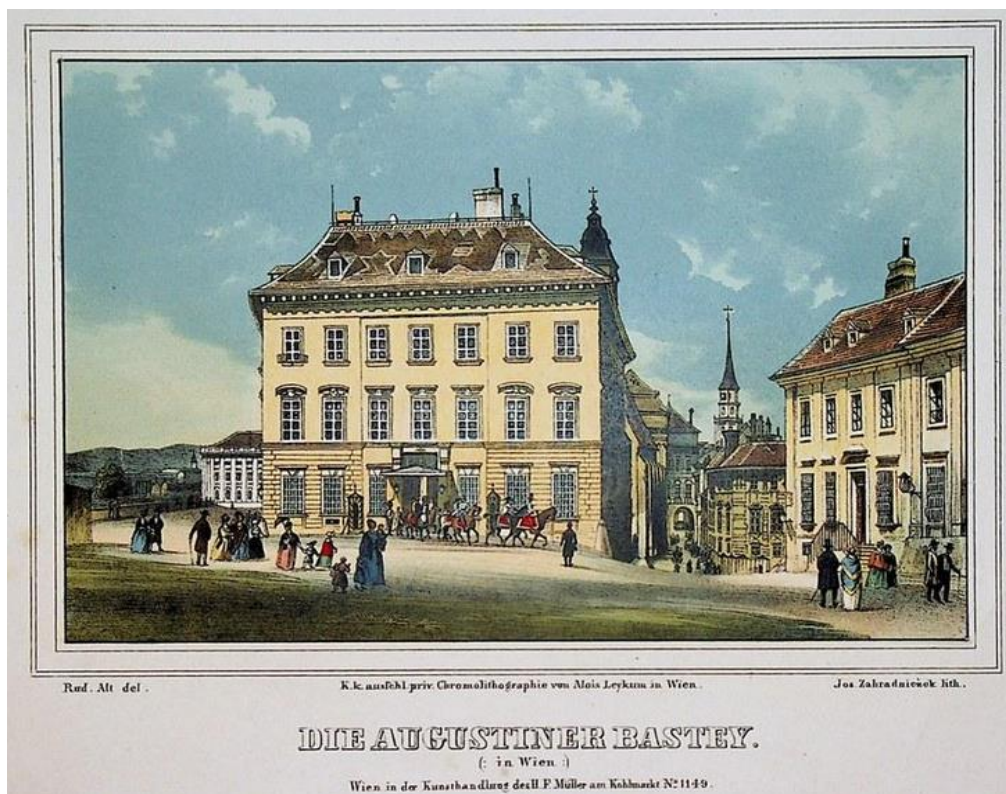
Litografio ĉirkaŭ 1840