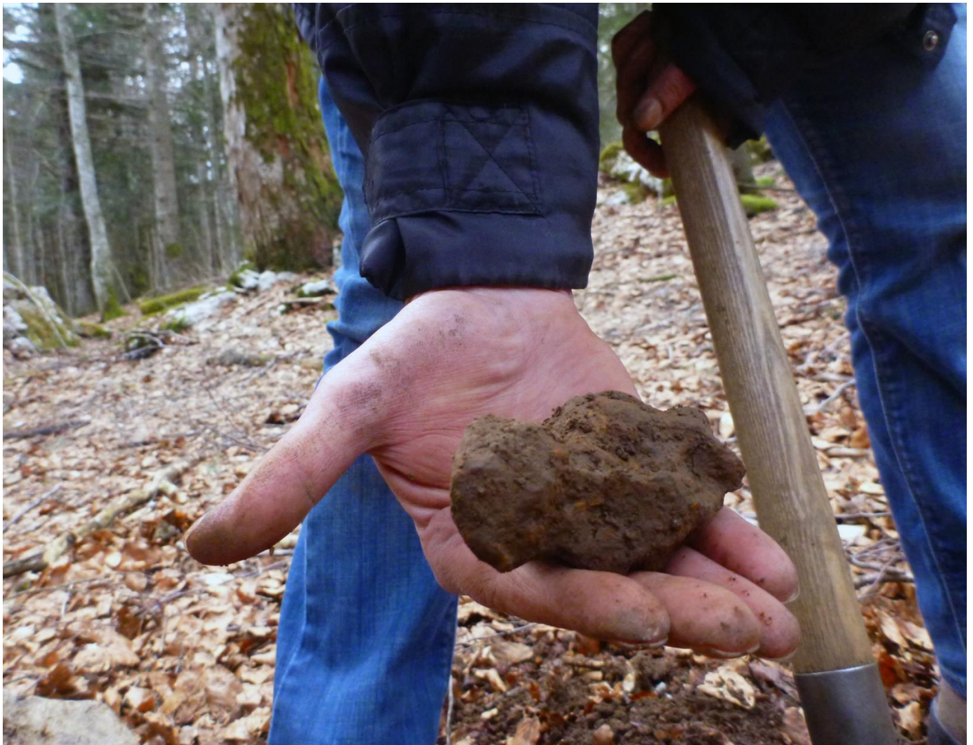
Fragmento de la Tvanberga Meteorito post la trovo.

https://de.wikipedia.org/wiki/Twannberg_(Meteorit)