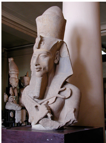
Egipta faraono Amenhotep IV (Aĥnaton)