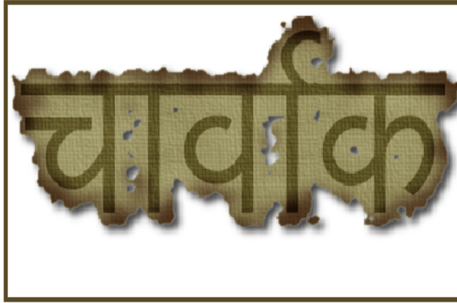
Sanskrita formo de la vorto “Ĉarvako”.

brahmanaj pastroj. La Ĉarvakanoj kritikis kaj mokis brahmanajn / vedajn kredojn kaj ritojn, kondamnis la kasto-sistemon, kaj riproĉis al la pastroj, ke ili trompas ordinarajn homojn por mone profiti.