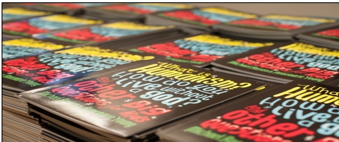
Kio estas humanismo? estis disdonata al lernejoj en ĉiuj regionoj de Britujo. La subtitolo tekstas: “Kiel oni vivas sen dio? kaj aliaj grandaj demandoj por infanoj”.

La disdonado estis financata per mondonacoj de humanistoj tra la tuta lando. Andrew Copson, estrarano de BHA, komentis: “Neni- am estis tiel grave, ke infanoj lernu pri la mal-