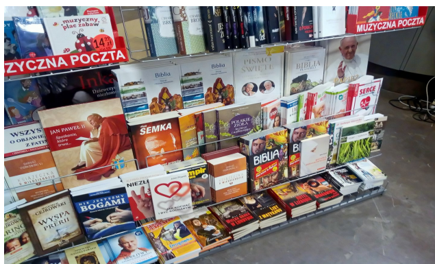
Kristanaj / katolikaj libroj vendataj ĉe la centra poŝtoŝtanco de Varsovio. Ĉu la ŝtata Pola Poŝto nun apartenas al la Katolika Eklezio?!

Ne hazarde la modernaj ŝtatoj disigas ŝtaton de religio. Tio okazas certe pro la historia malfacileco disigi religion de siaj mitmoralaj radikoj. Kaj tiu disigo estas marko de moderneco. Ankaŭ ne hazarde iuj religioj moderniĝas, reinterpreterante la radikojn kaj tiel akceptante novajn rolojn. Sed aliaj ne moderniĝas kaj favoras religiajn ŝtatojn, la teokratiojn.