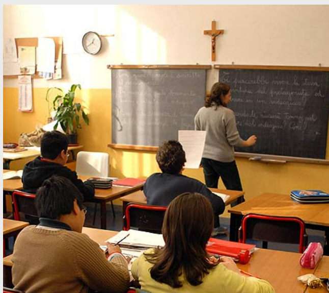
Krucifikso en itala klasĉambro