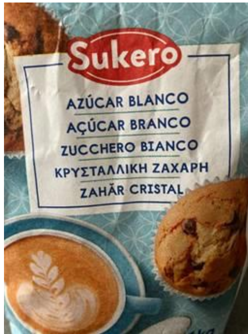
El fejsbuko, trovita de L. P.