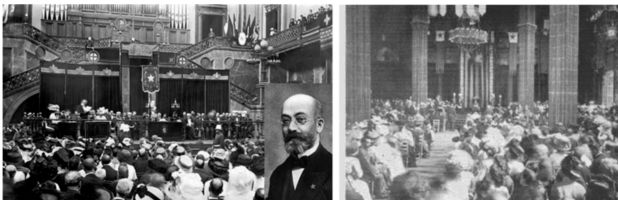
V Congreso Esperanto - Barcelona 1909.

En diciembre de 1908 tuvo lugar la renovación de la junta directiva para el siguiente ejercicio, resultando ser: