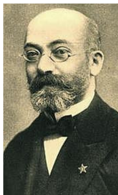
Cien años de un ideal

Los esperantistas están de celebración. Este año se cumple el 150.º aniversario del nacimiento de Luis Lázaro Zamenhof en la entonces Polonia rusa, que con los años sería el iniciador de la lengua internacional esperanto. Y en Gijón de doble celebración, puesto que el 4 de junio de 1909, hace un siglo, nació en la villa la Asociación Asturiana de Esperanto en el seno del Centro Católico, que tenía su sede en la calle de San Bernardo. Fue la primera entidad esperantista creada en Asturias, a la que al año siguiente seguiría su estela otro grupo dentro del Ateneo Obrero de Gijón.