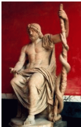
Asklepio kun bastono kun volviĝinta serpento.

Li edzinigis Epione (Salus) kaj patriĝis. Du el liaj filoj, Machaon kaj Podalirius, fariĝis ĥirurgoj de la greka armeo en la troja milito. Inter la kvin filinoj de Asklepio estis Iaso (pli bone konata per la latina nomo Meditrina), Higiea kaj Panacea, respektive diino de kuracado, diino de sano, kaj enpersoniĝo de ĉiokuracantaj drogherboj. Asklepio lernis kiel revivigi mortintojn per uzo de la sango de serpentthara gorgono. La sango de la maldekstra flanko de la gorgono estis mortiga veneno, sed tiun de la dekstra flanko Asklepio uzis por revivigi mortintojn. Estis Atena mem kiu donis ujon kun gorgona sango al Asklepio. Hadeso, frato de Zeŭso, plendis, ke pro la laboro de Asklepio, ne sufiĉe da mortintoj alvenis en la subteran mondon. Tiukiale Zeŭso mortigis Asklepijon per fulmo-frapo. Kvankam Apolono ne povis helpi sian filon, li mortigis la ciklopojn kiuj forĝis la fulmaĵojn uzitajn de Zeŭso. Zeŭso, malgraŭ la mortigo, rekonis ke Asklepio estis laŭdinda resanigisto kaj ŝanĝis lin al la konstelacio „Ophiuchus”, la serpentportanto.