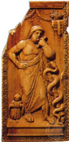
Asklepio, de ebura diptiko, 5a jarcento pK, de Urba Muzeo, Liverpool, Anglio.

Asklepio (greke, Ἀσκληπιος , Asklepios) estis la antikva dio de medicino. Fakte, laŭ helena mitologio, li estis parte dio kaj parte mortonto. La patro de Asklepio estis la dio Apolono. En tiu epoko, dioj ofte kondukis tre home: Apolono delogis la patrinon Koronis. Laŭ kelkaj rakontoj, Koronis estis nimfo aŭ duondiino, kaj laŭ aliaj, ŝi estis filino de Flegias, reĝo de Tesalio. Kiam Koronis ankoraŭ portis Asklepion en la utero, Apolono eltrovis, ke ŝi havis homan amanton kaj koleriĝis. Laŭ diversaj rakontoj, aŭ Apolono aŭ Artemiso, ĝemelino de Apolono, mortigis Koronis per fulmofrapo. La kadavro jam komencis bruli sur la funebra fajro kiam Apolono ŝiris la ventron de la mortintino kaj savis sian nenaskitan filon.