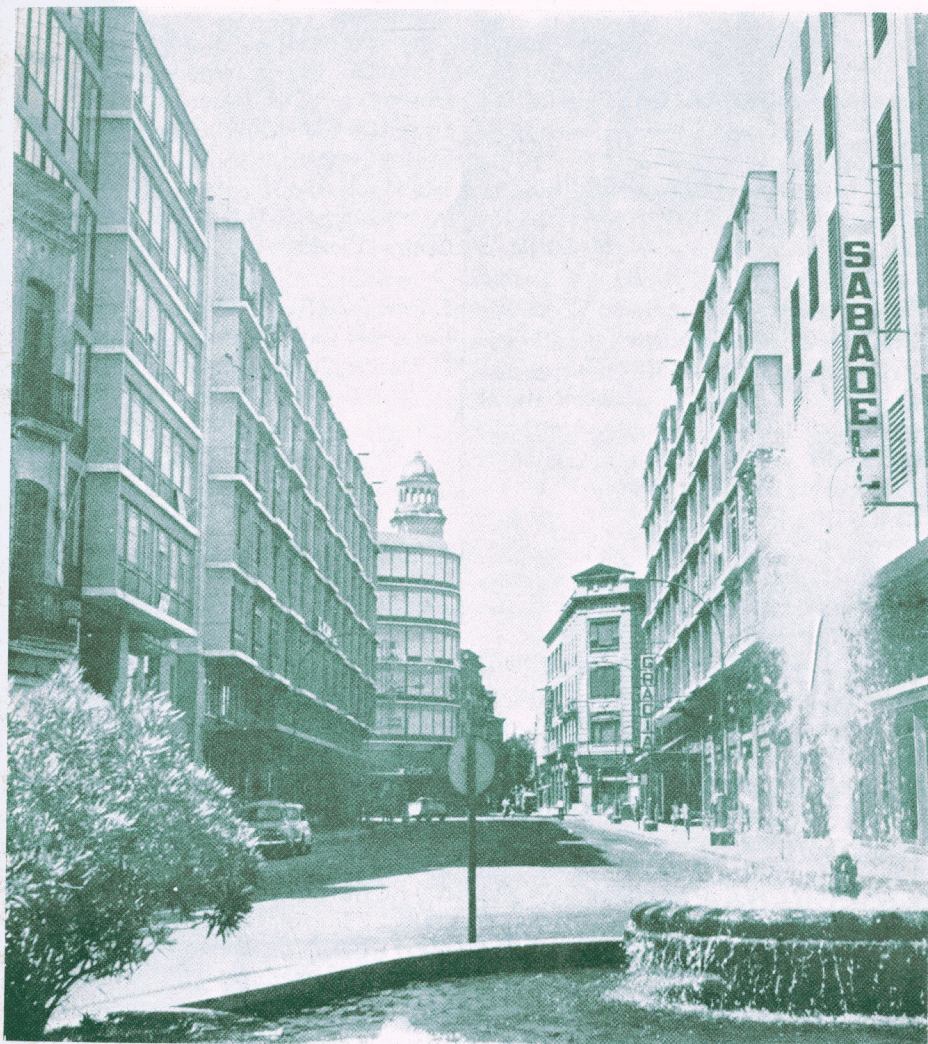
Paseo de Manresa