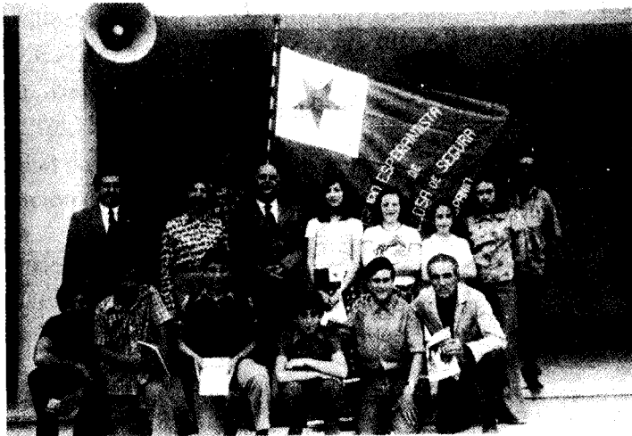
Colegio Nacional - 1973 - Ekuzo de Flago

La jarabono estas 2 usonaj dolaroj. La dezirantoj povas sendi la abonsumon al nia konto: 463-029-3006, Bulgara Eksterlanda Komerca Banko, Asocio de Sciencaj Laboristoj en Bulgario. Aparte ili skribu informan leteron al nia redakcio pli iliaj abonoj kaj adresoj al: Asocio de Sciencaj Laboristoj en Bulgario, Redakcio de "Scienc-a Mondo", bul. Tolbuhin 18. Sofia 1000, BULGARIO.