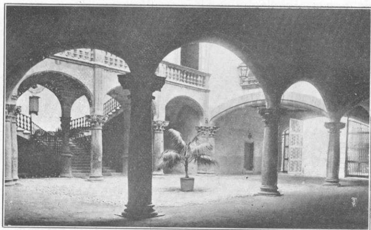
Korto de la Domo de la Marquizo de Vivot