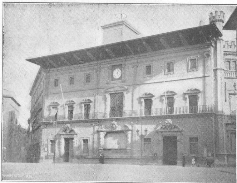
Urbodomo de Palma