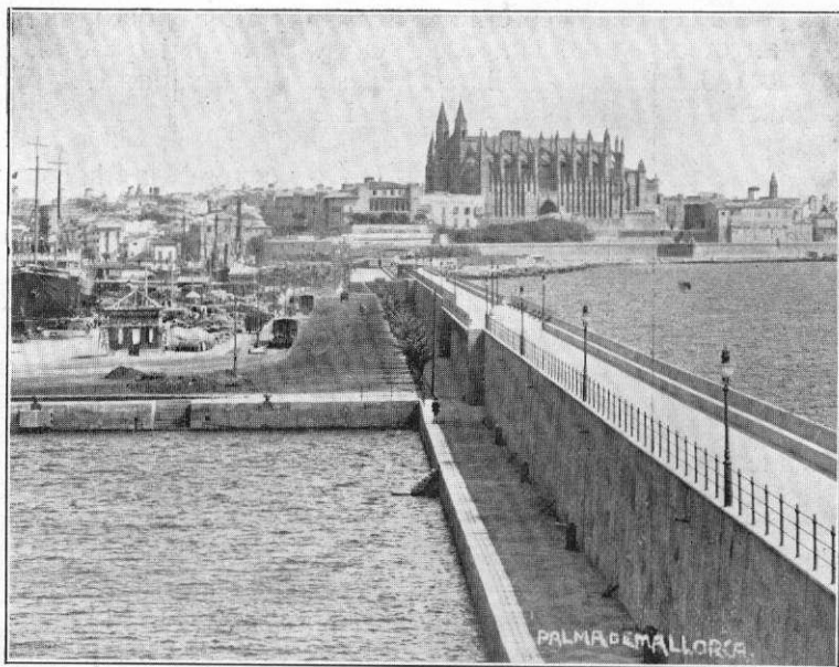
Haveno de Palma