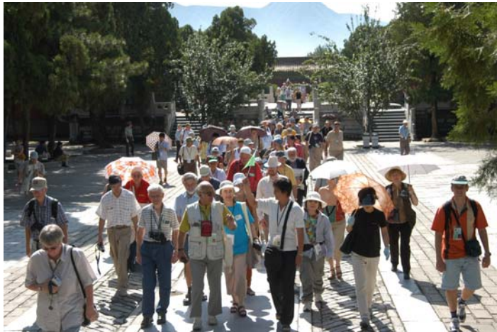
Ĉe la Ming-Maŭzoleo