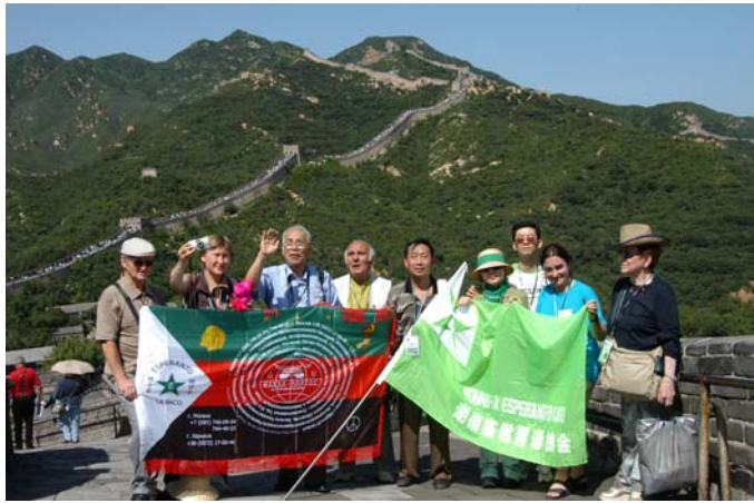
Sur la Granda Muro

Ĉinoj diras, oni ne estas heroo sen supren-iri sur la grandan muron. Hieraŭ niaj kongresanoj surgrimpis la Grandan Muron. Do ni ĉiuj estas herooj!