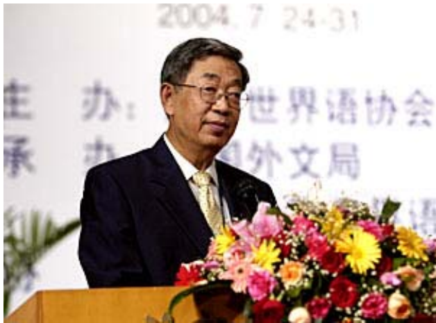
Parolado de Xu Jialu, vicprezidanto de la Konstanta Komitato de la Ĉina Popola Kongreso, en la malfermo de la 89-a Universala Kongreso de Esperanto (Matene 25-an de julio)

Estimata prezidanto, Karaj gekongresanoj, Bonan matenon!