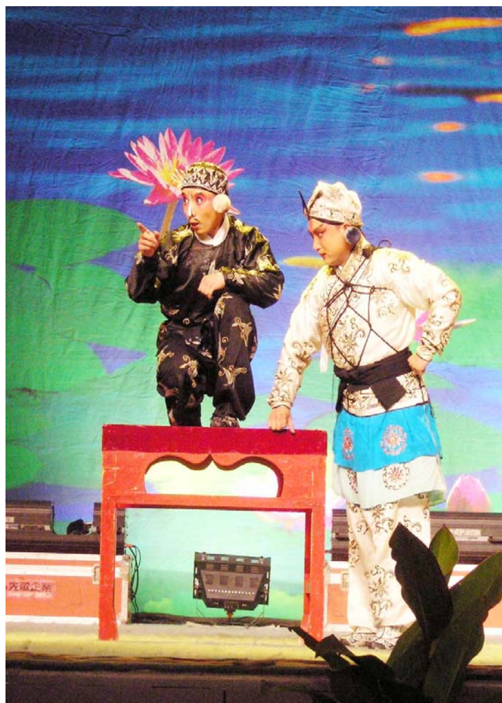
Lukto dum Nokto en Hoteleto ĉe Voj-kruciĝo, Beijing Opero en Nacia Vespero