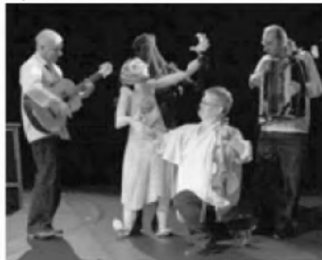
Fasado. La tre ekvilibra koktelo de la du artaj ĝenroj de teatro kaj de pupoj estas la unua trafaĵo de tiu prezento. Ĝiaj vigla realigo, plensceneja bunto, lingve riĉa fantazio estas la pliaj ĝuindaj surprizoj por la publiko.