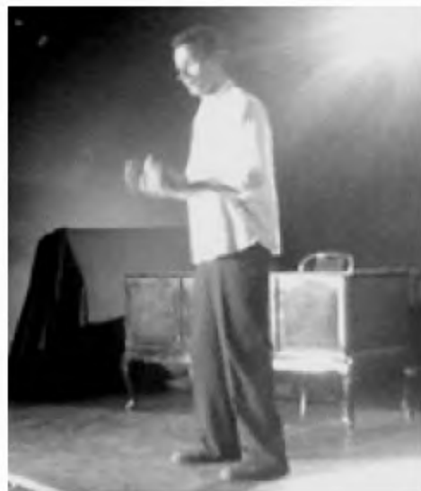
Impresis kortuŝe la prizamenhofa teksto de Migliucci, kiu per unu voĉo prezentis mult-rola la kreon de nia lingvo tra la ĉe ni konataj epizodoj kaj per lertaj aŭtoraj teatraĵ eltrovoj. La teatraĝo, kiu jam fariĝis DVDA filmo, estos pro sia sukceso replikata ĵaŭde je la 10h30, ĉiam ĉe kafejo Fama, Legionowa 5.