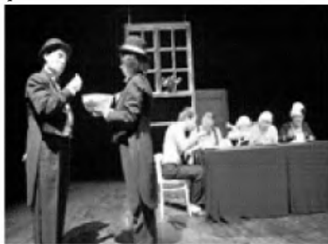
Domo sur la limo groteske prirakontas la dramon de burokratio landlima, kiu elefante intervenas en la vivon de simpla familio. La escepto de la eventoj, la trafo de la traduko, la apudeco inter publiko kaj aktoroj, ĉio kontribuas al tiu ĉi neforgesbla spektaklo.