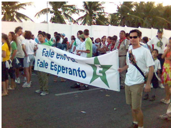
CEA en la Marŝo Porpaca en Fortaleza (2006)

Organo de Cearaa Esperanto-Asocio - Brazilo - 2-a Jaro - n-ro 5 - Februaro 2007/1 http://www.esperantoceara.org.br