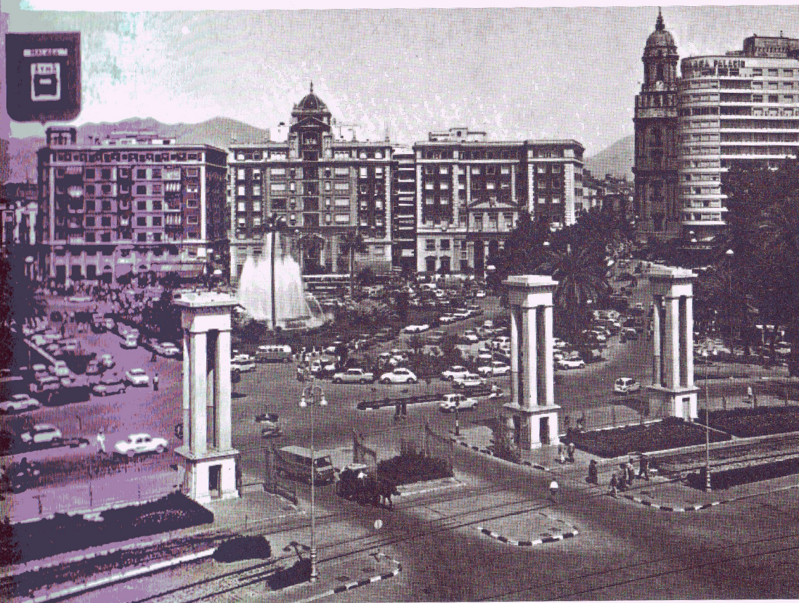
Haveneniro kaj Placo «de la Marina»