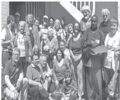
Kongresanoj pozas dum vizito al la sidejo

Oni devas gratuli la OKKanojn (de la grupo ILO de sudpariza urbo Kastelforto) kaj aliaj kunlaborantoj, pro sia strebo kaj sukceso, ĉar estis gravaj problemoj nek en la kongresejo nek en la restadejo nek dum la ekskursoj. La