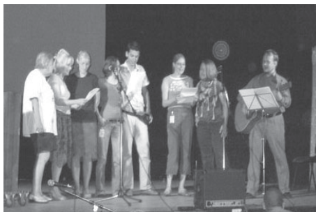
Dum la kantado