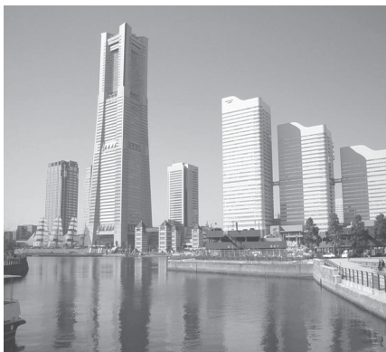
Urba pejzaĝo en Jokohamo

De la 5-a ĝis la 11-a de Aŭgusto okazis en Jokohamo, Japanio, la 92-a Universala Kongreso de Esperanto. Kiel kutime oni aranĝis multajn kromaktivadojn antaŭkongresajn kaj postkongresajn. Jokohamo estas havenurbo apud Tokio.