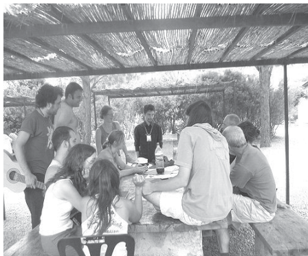
Dum kurseto.