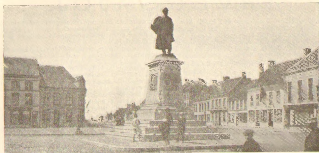
STATUO DE L'FLANDRA POETO K. L. LEDEGANCK EN EEKLOO.