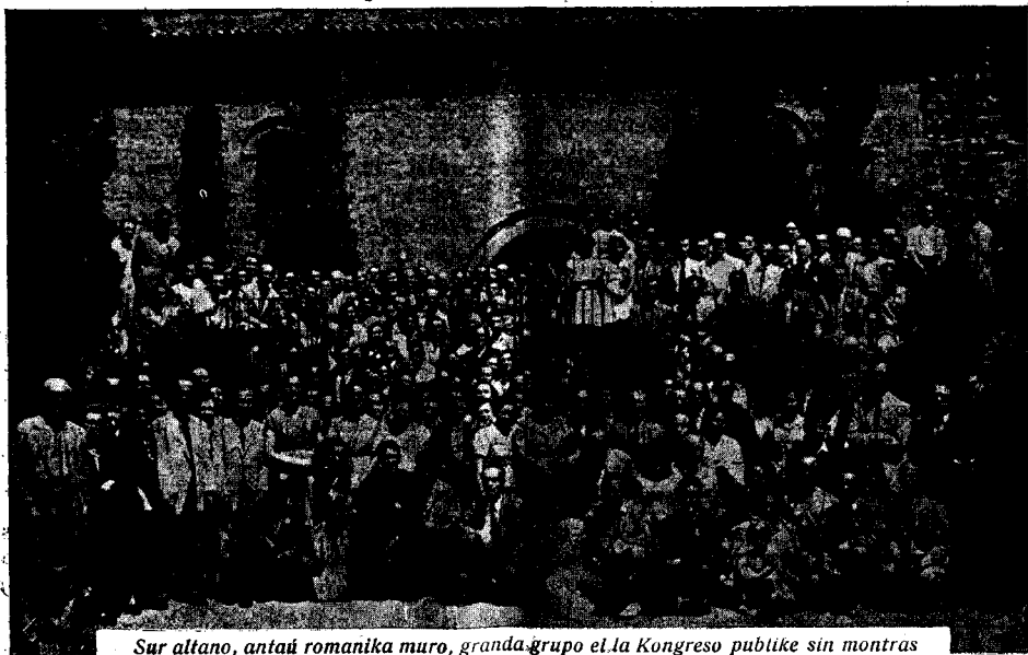
Sur altano, antaŭ romanika muro, granda grupo el la Kongreso publike sin montras

Tiu bona kutimo estu devizo imitinda! Sen forgeso, kompreneble, al la vulgara kutimo... vespermanĝi en ĉiu vespero, kion ĉiuj rapidis plej akurate plenumi, por ĉeesti ĝustatempe en la Folkloro Festivalo, en ĝardeno de belarta societo. Ĉarma ripozo, delikata ĝuo por la spirito, estis la belega prezentado de «sardanoj», la karakteriza kataluna rondodanco, kiun oni dancas laŭ ritmo de regula takto, tiel solene kaj atente, kvazaŭ plenumo de rito plej sankta. Facilmovaj junuloj kaj sveltaj knabinoj, kun tipaj kostumoj, plektis arbeskojn, laŭ la melodio de ĉiu aparta danco, el la diversaj regionoj de Katalunio, por regali nin kaj mirigi nin. La spektaklo estis ja vera elmondo de arto, de popola arto, kiel ideala krono el filigranoj por ĉi tiu historia dimanĉo, kiun de frua mateno