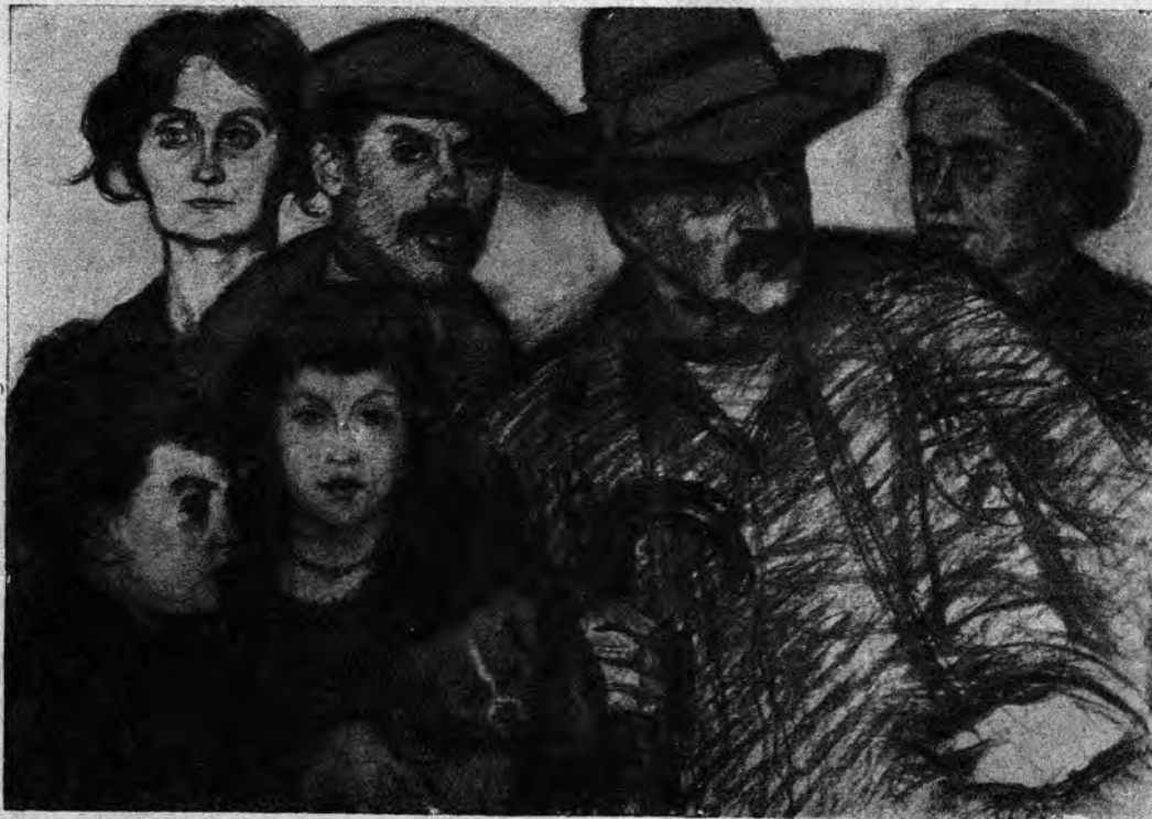
Jozefo Rippl Rónai: La aŭskultantoj

Tiam plenbruste kriegante: „Hŭ“, la veturigisto fortege vipadis la bestojn. Ili moviĝis, streĉiĝis kaj ekvojiris per lama kaj malrapida troto. Malantaŭ ili la veturilo, skuante siajn