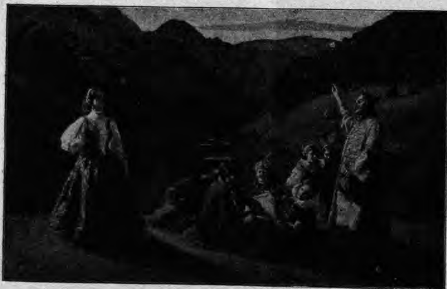
Béla Iványi Grünvald: Inter montoj