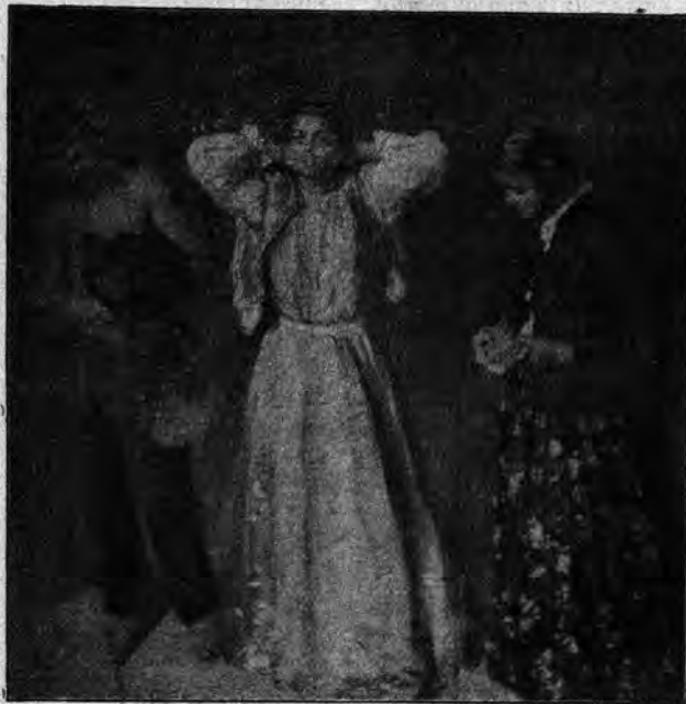
Karlo Ferenczy: Ciganoj.