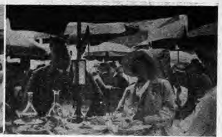
S-ro Kreuz post iom da manĝo

vaganta nun en cent direktoj. Sincere mi deziras plenan sukceson al tiuj, kiuj nun plenumas sian taskon respondecan je la intereso de la movado.