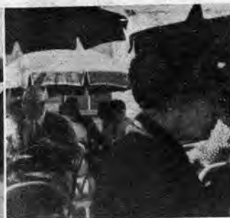
S-ro Merchant ne pensas pri organizio