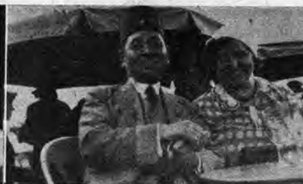
S-ro Nišimura amas la homaron