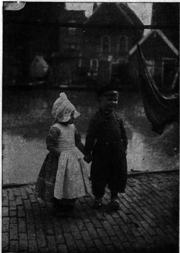
Infanoj el Volendam, Nederlando

»Je via senmorteco, ne,« mi respondis. »Mi estas nur tiu, kiu ekbruligis orfejon kaj mortigis blindulon por akiri liajn monerojn!« El la angla: G. Saville .