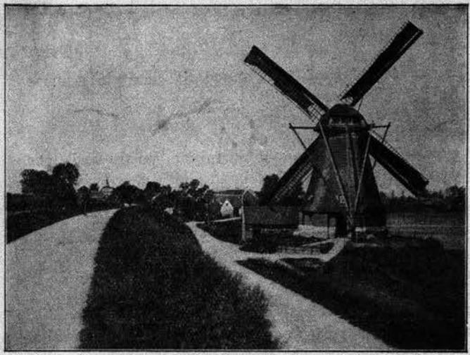
Waardenburga muelilo kaj digo

— Nur proksimiĝu al la muro, respondis la fantomo: miaj servistoj staras en la alia flanko; mi povas ilin vidi, ili ĉiuj estas grupigitaj en la marmora halo de la teretaĝo, vicigitaj en vitrino; ili vin aŭdos. Anstataŭ sabron tiom utilan por timigi la spiritojn, svingu vian pluvombreton kaj iru unue al la kvar ĉefdirektoj, kiel tion rekomendas la sorĉalvokaj formuloj.