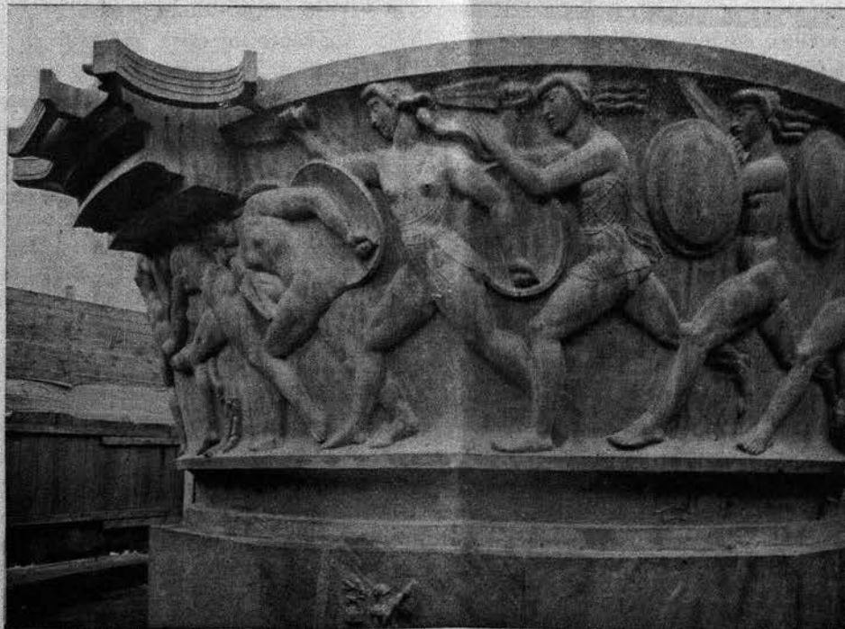
Milles: Industri- monumento antaŭ la Teknika Instituto, Stockholm

Nur unu lin ĉagrenis: ĉio ĉi elreligi lin el la antaŭa ordinara, kvietita vivo, kie ĉio estis tiel hejmeca, simpla, komprenebla kaj jetis ien en mondon malamikan, kie la aero estis ĉiam elektrigita, kie oni ĉiam devis esti singarda, por ne esti kroĉita per hoko, por ne fali en lupokavon.