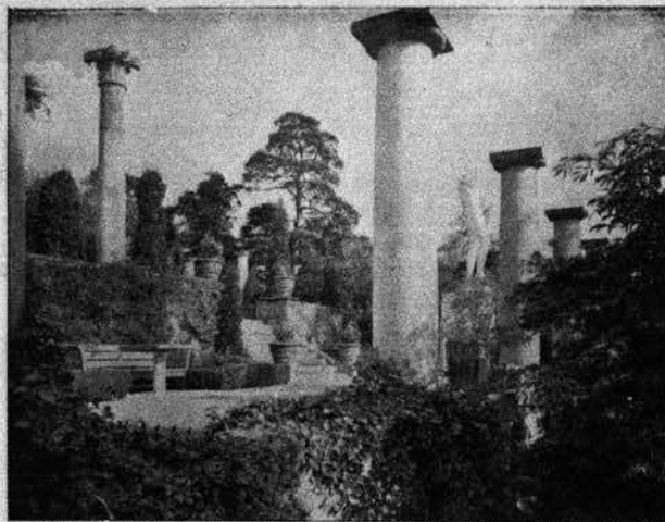
Teraso en la hejmo de Milles

La maljuna avo estis malsana. Serioze, treege. La bienetanojn kolerigis tiu ĉi nelaŭsezona malsano: kiu havas tempon por flegado dum kamplaboroj? Ankaŭ Maran lastatempe ne havis emon al hejmesidado. Restis nur Loki, kiu devis restadi hejme. Si profitis la okazon venĝi al avo. Faris ĉion male al ordono, se ŝi entute ion faris.