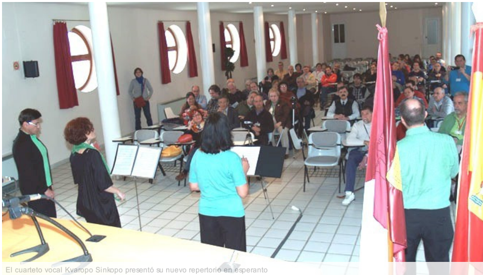
El cuarteto vocal Kvaropo Sinkopo presentó su nuevo repertorio en esperanto

Unas 130 personas procedentes de Estados Unidos, Australia, Francia, Rusia y muchos puntos de España, se dan cita estos días en el 72º Congreso Español de Esperanto que se celebra en Almagro (Ciudad Real)