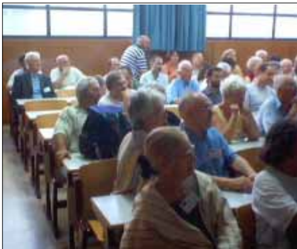
Neskanĉindigitaj esperantistoj interese aŭdas la prelegon pri la lingvoj de Hispanio

Post afabla vespermanĝo, ni ĉeestis la prelegon de Djemil Kessous, kiu temis