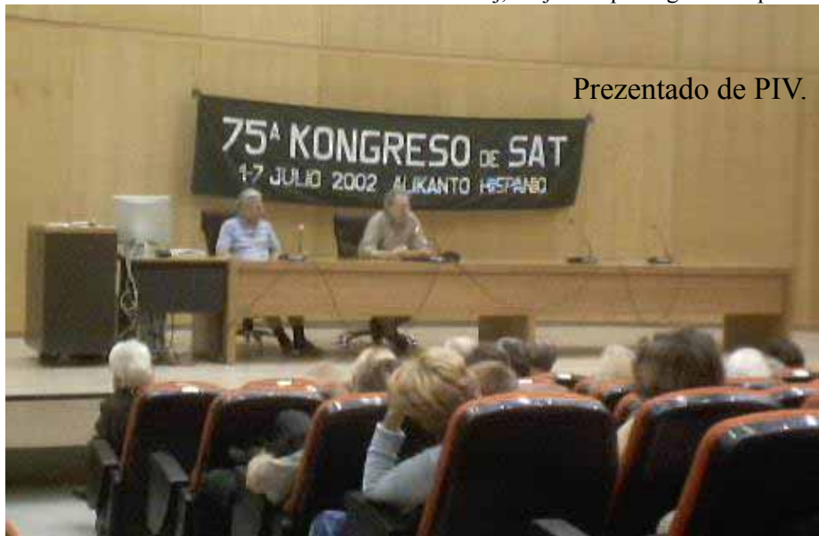
Prezentado de PIV.

Ekskamarado Jakvo diras, ke li havas problemon, ke li trovas nenion pri kio li povas plendi . Evidente li estas blinda, aŭ sekteca, kio estas eĉ pli grava misfortuno. Evidente, ne estas problem, laŭ li, ke la Rektoro de la Universitato de Alikanto, aŭ la Deano, aŭ Vicdeano de la koncerna fakultato, ne vizitis la kongreson. Evidente, ne estas problem, ke la Urbestro ne renkontis la kongresantojn. Aŭ la Vicurbestro. Evidente, ne estas problem, ke la ĵurnaloj de Alikanto ne rimarkis, ke estas Monda Kongreso de Esperanto. Kaj evidente ne estas problem, ke estis neniu afiŝo ekster la kongresejo, kiu informas, kie la Kongreso okazas. Por hispanoj ne estas tiom malfacile demandi kaj trovi la ejon, sed oni pensu, ke monda kongreso temas ĉefe pri homoj de aliaj landoj, kiuj ne nepre regas la hispanan.