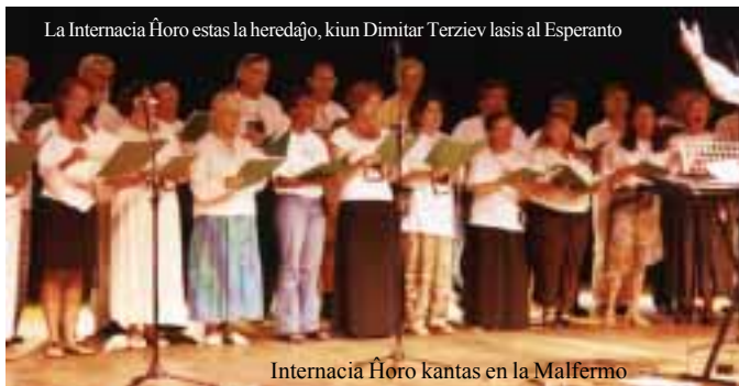
Internacia Ĥoro kantas en la Malfermo

La Internacia Ĥoro estas la heredajo, kiun Dimitar Terziev lasis al Esperanto