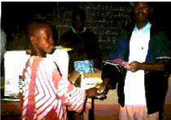
Benina infano ricevas diplomon pri Esperanto la pasintan aŭguston.