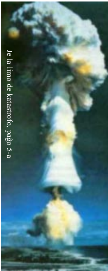
Je la limo de katastrofo, paĝo 5-a

Mi malaprobas ĉiun ajn militan agon de la Registaro de Hispanio, kaj mi deklaras min mala al ĉiu perforta ago kontraŭ la popolo de Irako, kaj rekta kaj ŝajniĝita de «kunflankaj efektoj», kiu estas la plej hipokrita esprimo per kiu oni kaŝas murdon de senkulpaĵaj civiluloj.