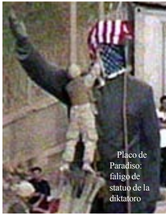
Placo de Paradiso: faliĝo de statuo de la diktatoro

Kaj mi aldonu fine, ke tion farante, la Triobla Alianco ne nur savos siajn registarojn de estonta biologia aŭ ĥemia milito de Irako kaj aliaj malgrandaj grupoj da teroristoj, sed ankaŭ al tiu bonintencaj civitanoj, kiuj kontraŭas la militon nun. Tio, ke ili povu kontraŭu publike la agon de siaj registaroj, estas unu el la plej defendindaj trajtoj de demokratia sistemo. Tamen, vere ĉagrenas min, ke samtempe, tio estas pruvo, ke la plej alta grado de demokratio estas tiu blanka ĉeko, kiun civitanoj de demokratiaj landoj donas al siaj registaroj ĉiun kvarjarperiodon. Tio ŝajnas esti morto de rekta demokratio... Tamen, demagogio nuna ŝajnas pruvi, ke plia grado da demokratio estas neeble.