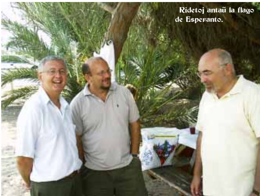
Ridetoj antaŭ la flago de Esperanto.

La sepan de la lasta septembro superlokaj esperantistoj kunvenis apud belega marbordo, en Guardamaro de l' Seguro, inter Alikanto kaj Mursjo. Jen kelkaj vizaĝoj tiam kaptitaj.