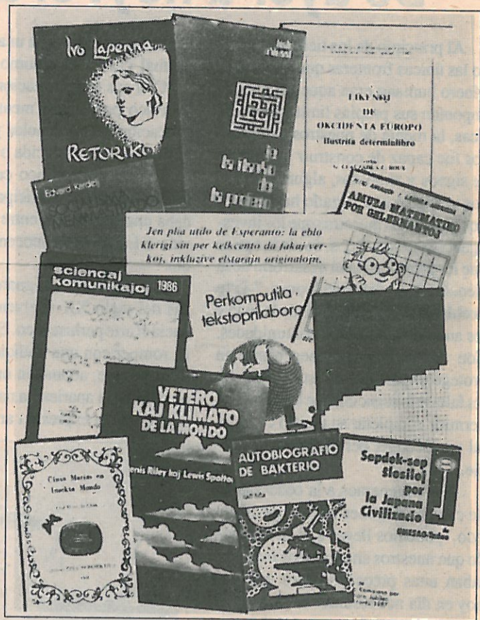
Publicaciones científicas y de divulgación en esperanto

Las organizaciones profesionales de los esperantistas comprenden organizaciones de médicos y personal médico, juristas, físicos, matemáticos, músicos y otros. Estas organizaciones organizan con frecuencia conferencias, editan su propia revista y ayudan a enriquecer el vocabulario para su