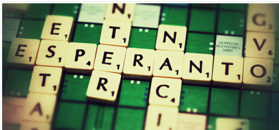
Esperanto estas internacia lingvo - Martin Schmitt

125 años de historia. Más de un siglo desde que la lengua viva más joven del planeta naciera no del uso de una sociedad, sino de la mente de un soñador criado en el conglomerado social y lingüístico de la Polonia del siglo XIX. Ludwik Lejzer Zamenhof (Ludovico Lázaró Zamenhof en castellano) dio a luz en 1887 a su 'Lingvo Internacia', un libro de 40 páginas que no pretendía simplemente sentar las bases de un idioma planificado, sino de unos principios que acabasen con la confrontación que, especialmente en Europa, surgía de banderas y fronteras a la menor provocación. El sueño de Zamenhof está lejos de ser cumplido, pero con más de 1 millón de hablantes de Esperanto en el mundo, nadie puede dudar que su esencia y su particular lucha siguen muy vivas.