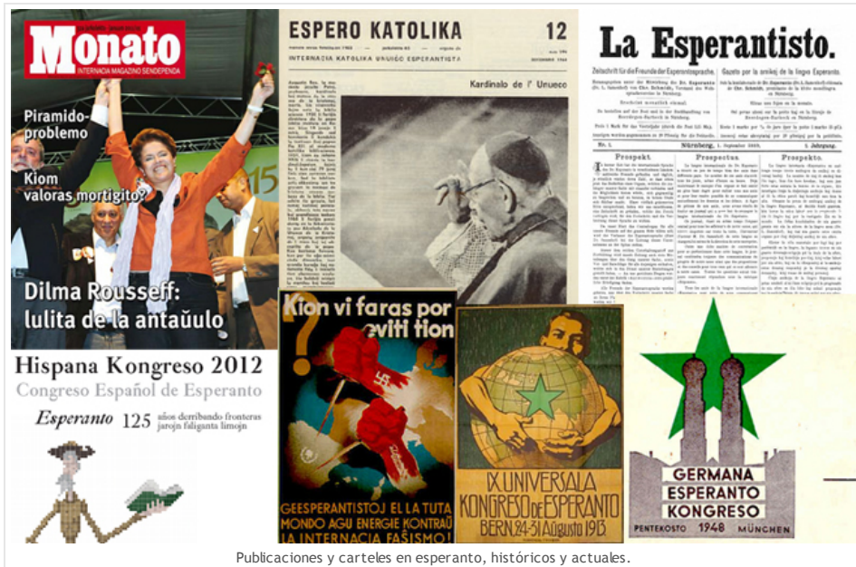
Publicaciones y carteles en esperanto, históricos y actuales.

El carácter de lengua auxiliar del esperanto podría hacernos pensar que su única y exclusiva funcionalidad es de hacer de puente entre nativos de otros idiomas. Nada más lejos. El esperanto, como cualquier lengua natural, cuenta con su propia producción cultural. No es únicamente una herramienta, sino también un medio. El propio Zamenhof tradujo libros como el Antiguo Testamento o Hamlet a su idioma, además de crear toda una colección de proverbios y poesía de su puño y letra. Esta rama de la producción escrita iniciada por su propio creador propiciaría que hoy en día estén documentados cerca de 200 poetas que escriben sus trabajos en esperanto. Las traducciones de obras en otros idiomas son especialmente numerosas, accesibles muchas de ellas en espacios como 'Literatura en la reto' . La música tampoco escapa al esperanto, y en emisoras online como Muzaiko podemos descubrir grupos que van desde el folk a la ópera, pasando por el rock.