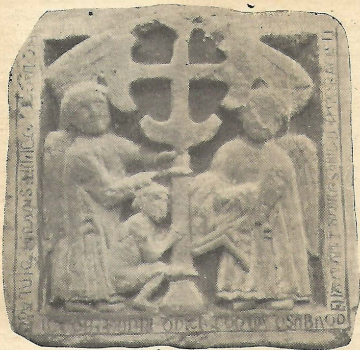
RELIEFO DE TOMBO ĈE LA TRE ANTIKVA PREĜEJO ROMANSTILA (S. PETRO.—HUESCA)

elmontritaj restas aŭ persistas netuŝeblaj, 7 kaj ili estas kvazaŭ leĝoj aŭ principoj nutrantaj la spiriton de ĉi tiu popolo el 400 milionoj da animoj.