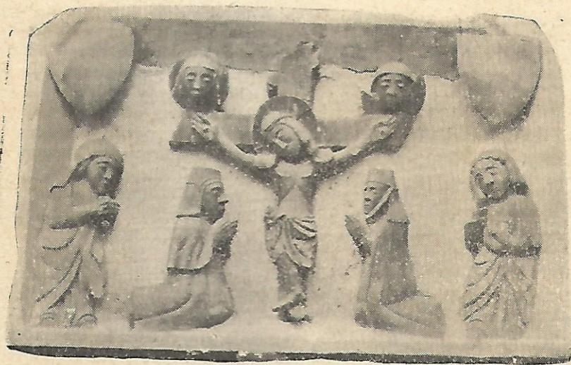
RELIEFO DE TOMBO (S. PETRO.—HUESCA)

Oficiala Organo de "Zamenhofa, Andaluzia kaj Arágonia Federacioj,"