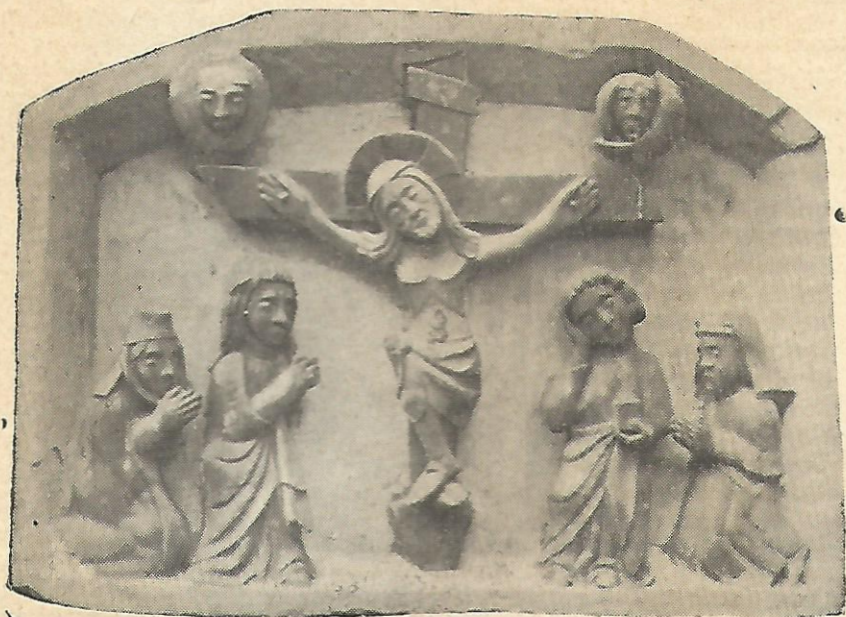
RELIEFO DE TOMBO (S. PETRO.—HUESCA)

panujo kun landkarto kaj ĉio utiligebla por firmigi la konon (bildoj k. c.); 3. e Geografio de la Tero; 4. e Geografio astronomia. Tial ke mi kredas, ke ne estas bona sistemo komenci la studadon je la Astronomio, kio estas plej malfacila, kaj fini je la provinco, kio estas plej facila. Al kelkjara infano, oni ne povas komprenigi, ke Tero estas sfero kaj ke ni havas Antipodojn; sed al dekdu jara knabo tio ja estas pli facila.