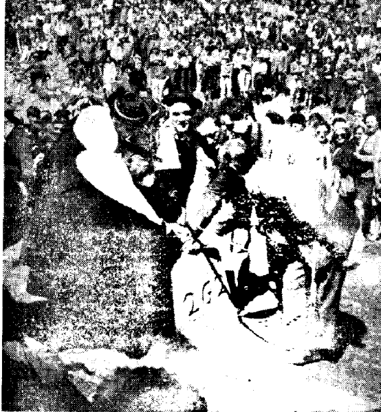
La turo da manoj

Du malsamaj heroaj tradicioj ekzistas pri la tributo. Laŭ la unua, ĝi devenas de la Barbaraj konkerintoj. Kiam