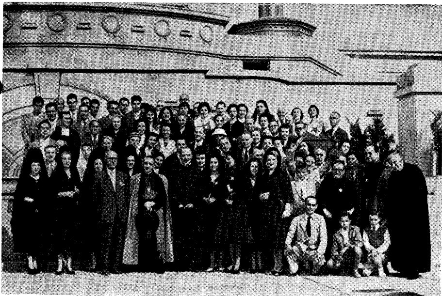
El Excmo. Sr. D. Casimiro Morcillo con un grupo de asistentes al 26º Congreso Internacional de Esperantistas Católicos.

Sean para él nuestras oraciones como un homenaje póstumo de nuestro agradecimiento y de nuestro cariño.