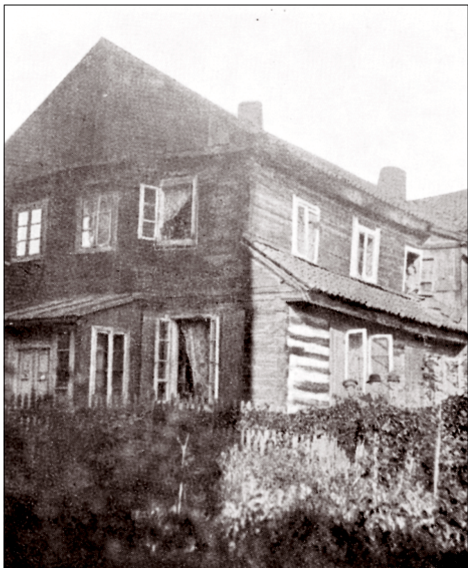
La naskiĝdomo de L. L. Zamenhof en Bjalistok