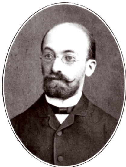
L. L. Zamenhof, 1887

”Mi estis tre ekscitita antaŭ tio ĉi; mi sentis, ke mi staras antaŭ Rubikono, kaj ke de la tago, kiam aperos mia broŝuro, mi jam ne havos la eblon reiri; mi sciis, kia sorto atendas kuraciston, kiu dependas de la publiko, se ĉi tiu publiko vidas en li fantaziulon, homon, kiu sin okupas je ’flankaj aferoj’; mi sentis, ke mi metas sur la karton tutan estontan trankvilecon kaj ekzistadon mian kaj de mia familio; sed mi ne povis forlasi la ideon, kiu eniris mian korpon kaj sangon, kaj ... mi transiris Rubikonon.”