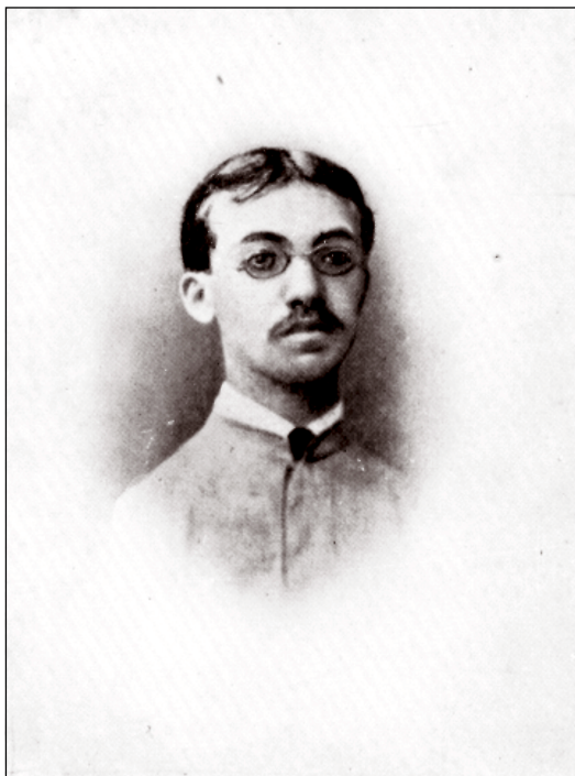
L. L. Zamenhof, 1875