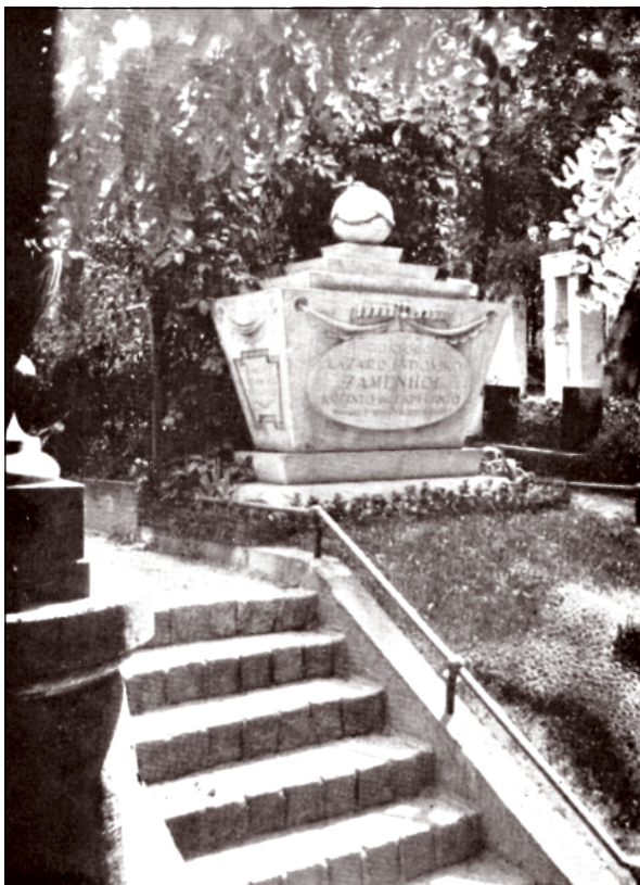
La toambo de Zamenhof en Varsovio, 1937