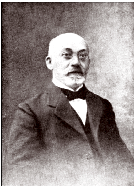
L. L. Zamenhof, 1917, la plej lasta foto