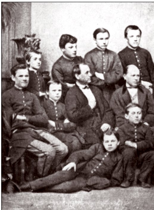
L. L. Zamenhof kiel juna gimnazianoj, 1873 (staras maldekstre, apogita al la florvazo)