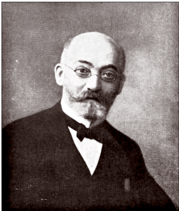
Lazaro Ludoviko Zamenhof