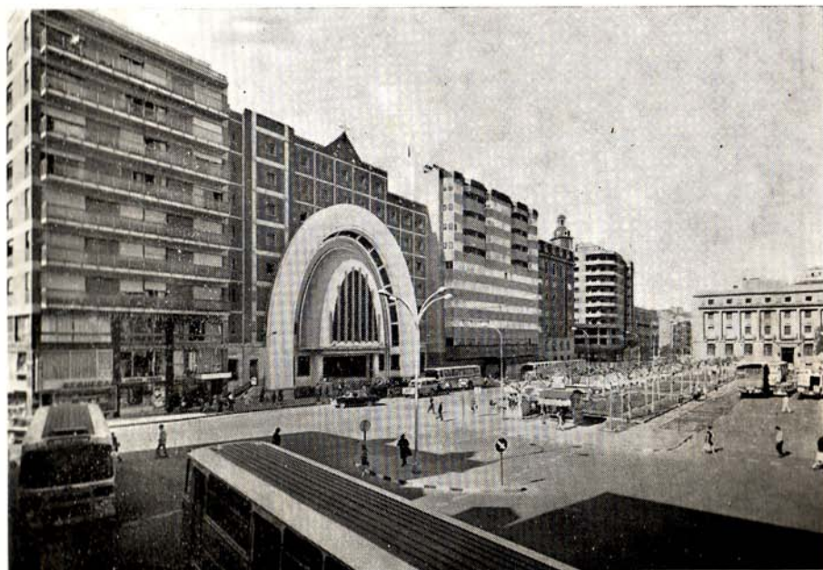
La nova urbo, Placo de España