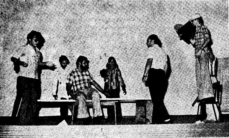
La trupo de Centro de Esperanto Sabadell surscenigas la teatraĵon «Dramo senfina».