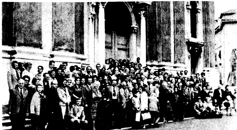
Grupo del kongreso en Italio

Reveninte Hispanujon, mi vizitis la urbojn Ĝenovo kaj Perpinjano, kaj denove, mi trovis gastemaj esperantistojn. Ĉiuj gesamideanoj, kontaktigitaj dum mia vojaĝo, estis tre afablaj kaj eĉ kortuŝaj; por ili miajn plej sincerajn dankojn.