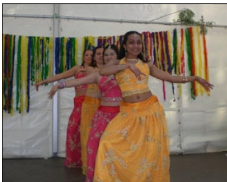
Grupo el la Kultur-Butiko prezentas dancadon