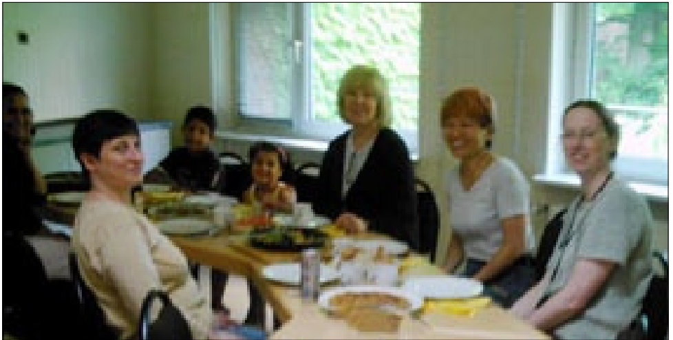
Dum la kuirkurso