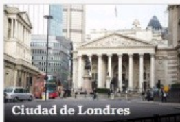
Ciudad de Londres