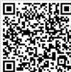
n-ro 2 (lundo)

La KK-redakcio pardonpetas al tiuj kongresanoj kiuj provis elŝuti la hieraŭan (lundan) numeron, sed ne povis. La ĝusta kodaĵo estis metita, sed akcidente tondita tiel ke necesa parto ne aperis. Jen sube espereble funkcipovaj kodaĵoj same por la lunda numero (maldekstre) kiel por la hodiaŭa marda (dekstre).