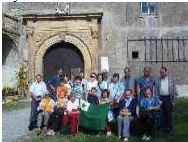
Antaŭ la kastelo

Post fotado la partoprenintoj kolektiĝis en loka gastejo por refreŝiĝi, sed ankaŭ por babili pri diversaj temoj. Al bona humoro kontribuis bonega somera vetero kaj entute bona etoso.