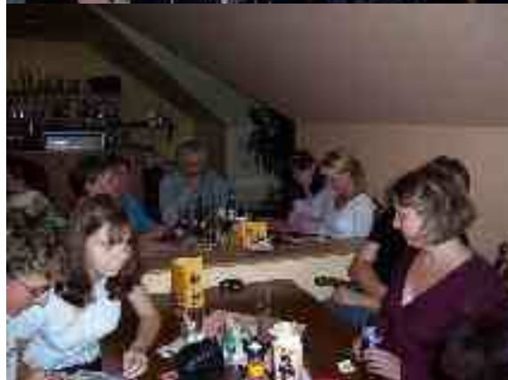
En la picejo