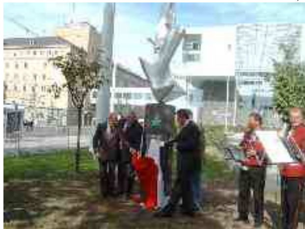
La IFEF-prezidanto d-ro Romano Bolognesi (maldekstre) kaj la urbestro de Linz d-ro Franz Dobusch (dekstre)