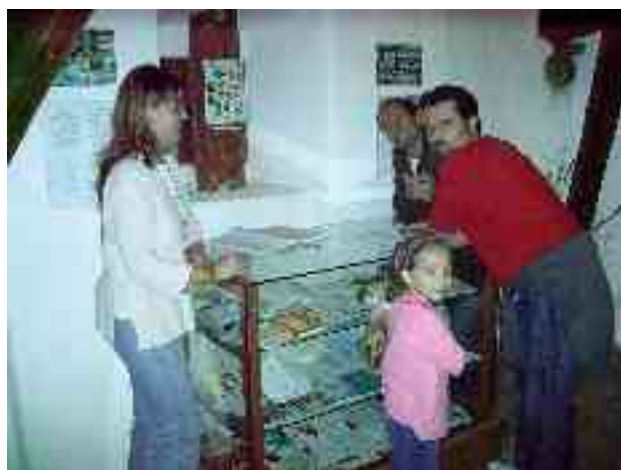
Ekspozicio pri Esperanto