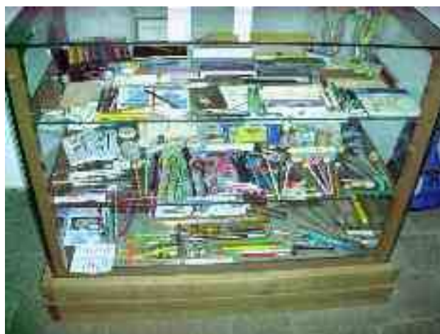
Ekspozicio de kraĵoj