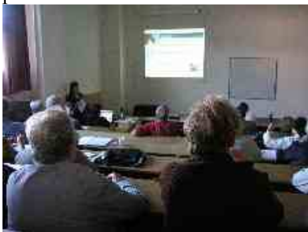
Dum la konferenco estis aplikata projekciado, ofte rekte el la interreto

por diskuti pri la iniciato ELFO (Esperantologia kaj literaturo forumo). La historia parto de la urbo estas vere vidinda, precipe la granda kvadrata placo kun pitoreskaj historiaj domoj, fontano en la mezo kaj iom flanke Nigra Turo kun 225 ŝtupoj, kies supro donas belan panoramon de la ĉirkaŭaĵo. Interesa estis ankaŭ konservita stacio de ĉevala fervojo el la 1840-aj jaroj. La sabata vespero finiĝis en picejo proksime de la universitato, kie estis preparita solena vespermanĝo, poste dancado kun riĉa tombolo.