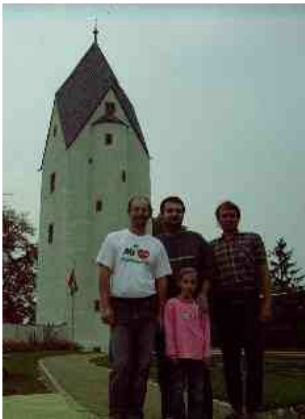
La Nigra Turo en Drahoňovice