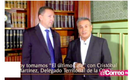
El Último Café (15/10/15)

El responsable de crear estas primeras palabras fue James Doohan, el actor que protagonizaba al personaje Montgomery Scott en la serie. Después, se fue perfeccionando gracias a los aspectos prácticos de su realización en el cine y al cuidadoso diseño llevado