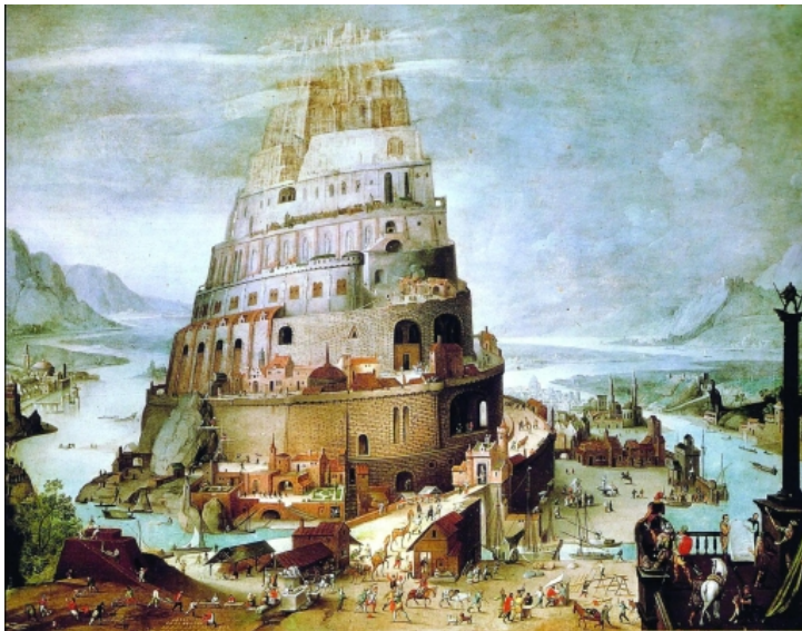
Torre de Babel tal como la imaginó el pintor Hendrick Van Cleve en el siglo XVI.

LETICIA GÁNDARA FERNÁNDEZ / SEVILLA / 12 OCT 2015 / 12:12 H.